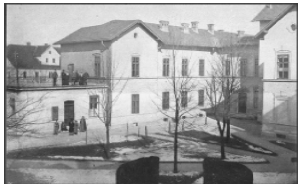
Sl. 2. Očesni oddelek – paviljon številka pet, leta 1912, na Vodmatu, Ljubljana (vir: Kolar, 1995).

Po koncu druge svetovne vojne so se razmere v bolnišnici precej izboljšale. Bolnišnica je postala učna baza Medicinske fakultete v Ljubljani in dobila naziv Klinične bolnice. Bolniški oddelki so se preimenovali v klinike, tako tudi očesni oddelek. Očesna klinika je bila v paviljonu številka pet in v tem paviljonu je ostala vse do januarja leta 2001 (sl. 2).