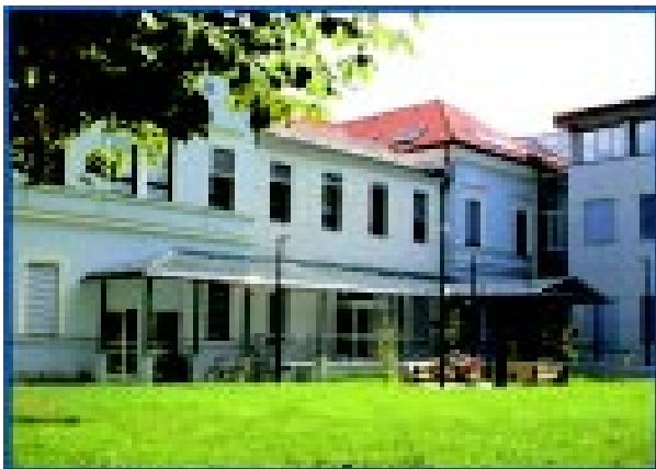
Sl. 5. Nova Očesna klinika na Zaloški 29a v Ljubljani leta 2001 (Foto: Klemenc B.).

Na Očesni kliniki se je leta 1956 odprl oddelek za ortoptiko in pleoptiko. Na tem oddelku so več let zaposlovali učiteljice, ker so smatrali, da je za delo z otroki primernejša izobrazba učiteljice. Izvajale so terapijo z vajami v prostoru in na različnih aparatih, kar je omogočilo razvoj vidne funkcije pri otrocih. Šele zadnjih trideset let so to delo pri nas popolnoma prevzele medicinske sestre. Zaradi specifičnosti dela je bilo potrebno dobro poznavanje anatomije in fiziologije očesa ter vseh posebnosti zdravljenja slabovidnosti in škiljenja, zato so se morale interno dodatno izobraževati. Vodstvo Očesne klinike je leta 1959 prevzela okulistka prof. dr. Carmen Dereani Bežek. Glavna medicinska sestra je bila v tem času Milica Salberger, ki se je šolala pred drugo svetovno vojno v Beogradu (Jarnovič, 1978).