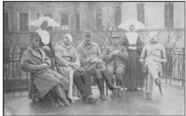
Sl. 1. Bolniki s sestrami usmiljenkami na terasi očesnega oddelka leta 1915.

njem trajanja šolanja preimenovala v Šolo za zaščitne sestre, se je izšolalo tudi več civilnih sester (Gradišek, 1992). Te so delovale predvsem v preventivi, v dispanzerjih, pri negi na domu, medtem ko so nego bolnikov v bolnišnicah še vedno izvajale redovnice (Miloradović, 1978). Takratna zdravstvena zakonodaja je opredeljevala šolanje ter delovno področje sester pomočnic, babic, zdravstvenih pomočnikov in bolničarjev, kjer je bilo izrecno napisano, da se mora vse osebje za negovanje bolnikov »brezpogojno pokoriti naredbam šefov, oziroma zdravnikov oddelka v vsem, zlasti pa glede negovanja bolnikov« (Dolžan 1931). Pred drugo svetovno vojno je bilo v Sloveniji 70 zaščitnih sester (Jarnovič, 1985).