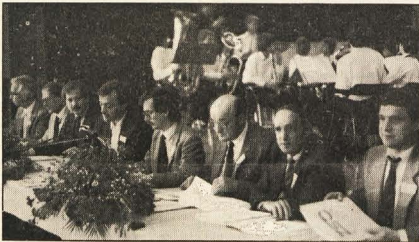
Pod predsedstvom članov izvršnega odbora (zgoraj) so delegati razpravljali in sklepali (spodaj) o perečih vprašanjih naše narodne skupnosti in sprejeli program bodočega dela ZSO.

Da je to možno in da rodi uspehe, so že pokazali razni stiki z mednarodnimi organizacijami, pa tudi s posamezniki — posebno razveseljiva je bila podpora, ki smo je bili deležni v boju za ohranitev dvojezične šole, kar se je odražalo v podpornih izjavah, v protestih, še posebej pa v znanstvenih in drugih publikacijah. Tudi mladina