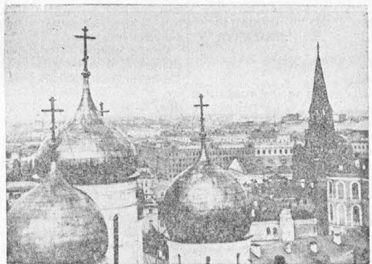
Preko kupol pogled na rusko prestolico ki je 800 let stara.

Sovjetsko subtropsko kmetijstvo je še mlado. Velika domovinska vojna proti fašistični Nemčiji pa je pustila hude sledove in preprečila, da bi se še hitreje in uspešneje razmahnila. Šele zdaj se je začelo znova intenzivno razvijati. Toda že uspehi, ki so bili doseženi, lahko služijo kot prepričljiv dokaz o uspešnosti kolhozne ureditve, ki je preobrazila kmetijstvo gruzinske sovjetske socialistične republike.