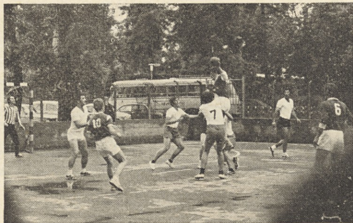
Rokometna ekipa Save med igro. Kljub slabemu vremenu in slabi organizaciji je bilo tekmovalje borbeno.

raj vse izgubljeno, saj je nasprotnik že vodil z 9:1, so začeli naši gristi in gristi. Ob zaključnem pisku sodnika so naši zmagali z dvema goloma razlike in se tako uvrstili v finale, ki je bil v nedeljo. V finalu so se srečali z ekipo Gazele. Prvi polčas je potekal v znamenju enakovredne moči. Zaradi izredno pristranskih sodnikov so naši tekmo izgubili in tako osvojili drugo mesto za Gazelo.