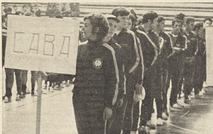
Ekipa naše tovarne med otvoritveno slovesnostjo V. gumijade v Skopju.

Savčani smo odpotovali v Skopje z letalom z Brnikov preko Beograda. V Skopju so nas na letališču pričakali domačini z avtobusom in nas prepeljali v naselje na hribočku nad Skopjem, po imenu Vodno, kjer smo v počitniškem domu Rdečega križa imeli prenočišča in prehrano. Tu so bili tudi tekmovalci iz Vulkan in Vrnjačke Banje. Imeli smo zelo lep razgled na celo Skopje, posebno še zvečer, ko so se prižgale luči.