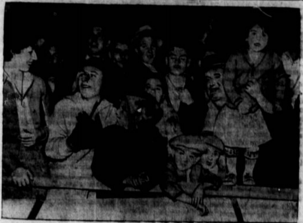
Skupina gledalcev, izražajočih navdušenje, ob linčanju dveh zločincev v Californiji.