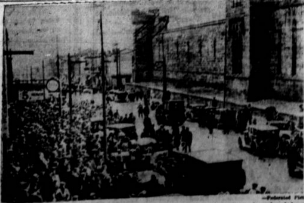
Pozar v kaznilnici vzhodne Pennsylvanije v Philadelphia. Zažgali so kaznjenci iz protesta proti nečloveškemu postopanju z njimi.