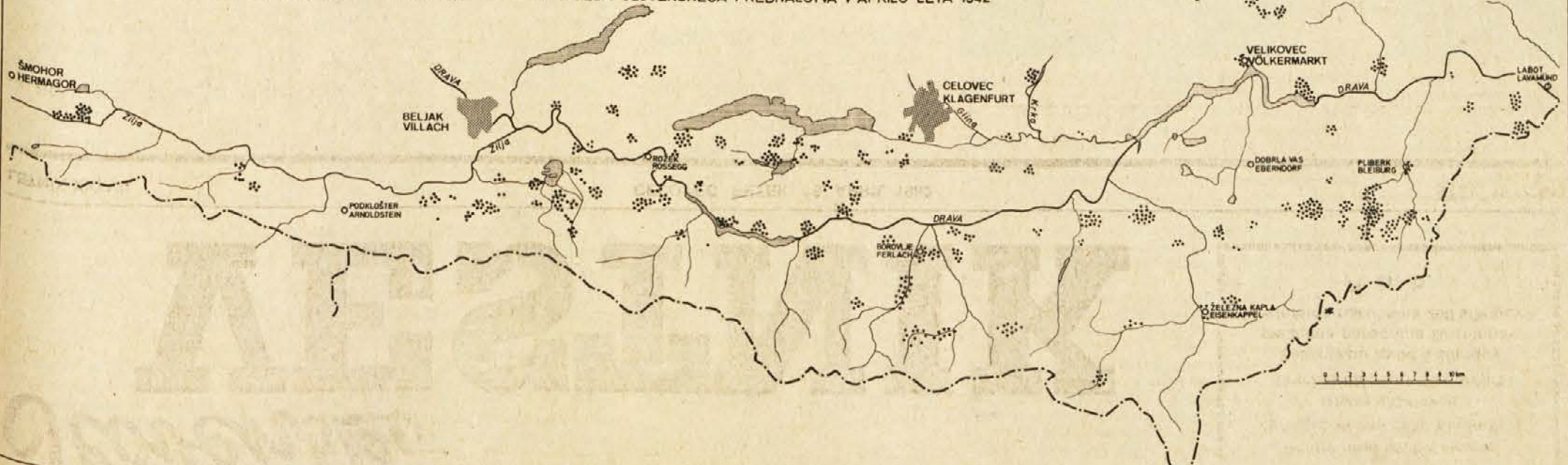
JUŽNA KOROŠKA KARTA NASILNE IZSELITVE DELA SLOVENSKEGA PREBIVALSTVA V APRILU LETA 1942