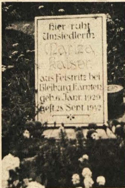
Ko so se po osvoboditvi vračali domov, so mnoge svoje sotrpine za vedno pustili v tuji zemlji.

Vendar tudi na Koroškem kolonizacija ni potekala brez problemov. Nekateri Kanalciani so odklonili naselitev na posestvih izseljenih