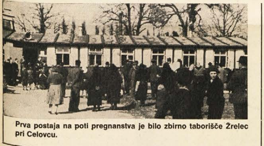
Prva postaja na poti preganjanja je bilo zbirno taborišče Zrelec pri Celovcu.

in bil vso dobo prve avstrijske republike predstavnik in zagovornik brezobzirnega zatiranja slovenskega življa na Koroškem.