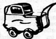
Otroški vozički najnovjših modelov