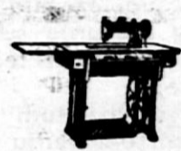
Šivalni stroji pogrešljivi