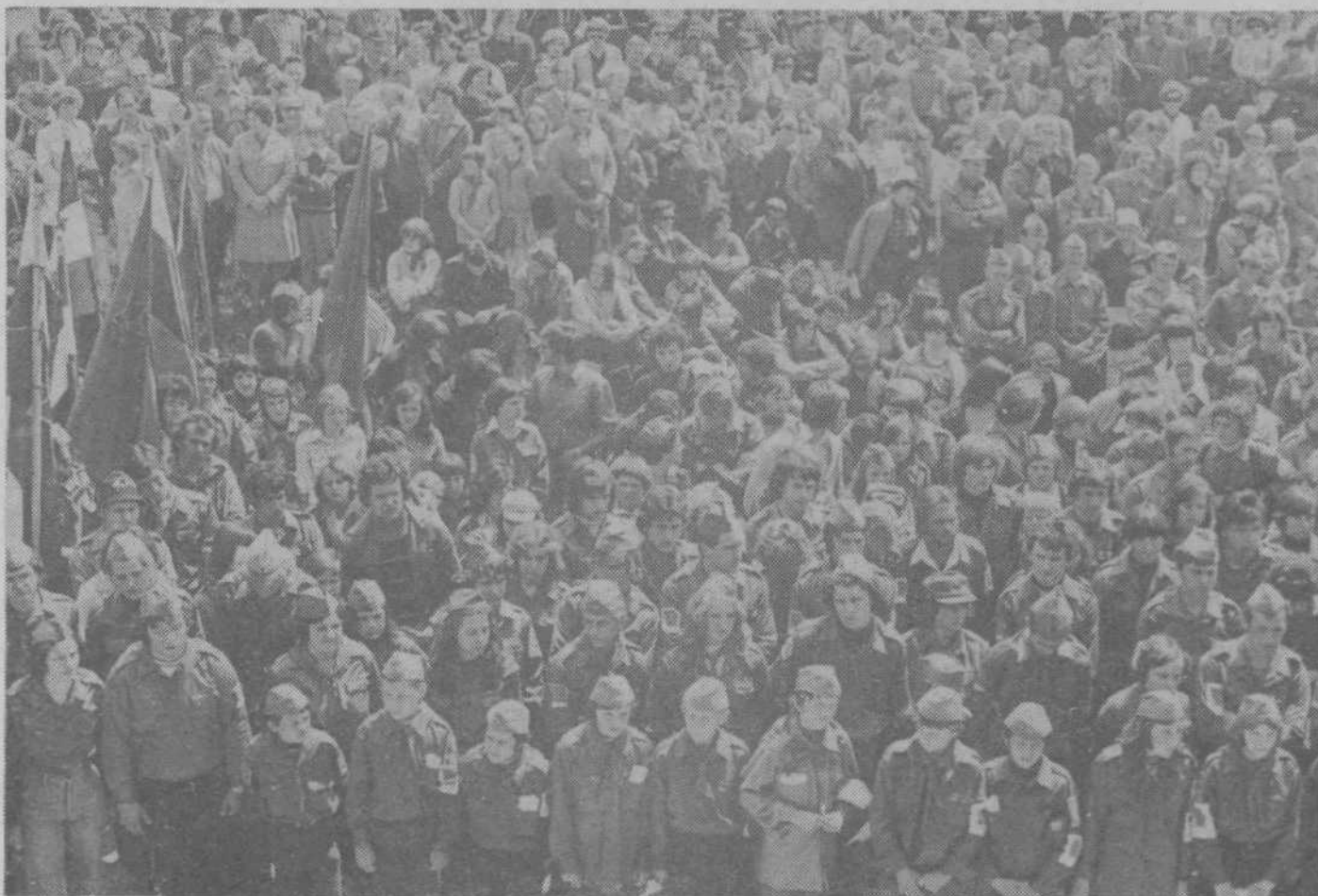
Prihajali so z vseh strani in brezštevni so se zbrali na poti k enemu cilju