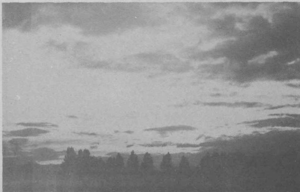
V nove zarje