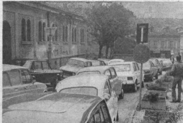
Na območju krajevne skupnosti Josip Prašnikar je veliko ozkih ulic, kjer je prometna gneča tolikšna, da včasih niti pešci ne morejo mimo. Kljub prometnim znakom, ki prepovedujejo parkiranje, je pločevine tudi na nedovoljenih mestih na pretek.

stora bo potrebno obnoviti vrsto starih poslopij,« pravijo v krajevni skupnosti. Zdaj imajo že načrte za ureditev dveh hiš na Petkovškovem nabrežju in treh v Trubarjevi