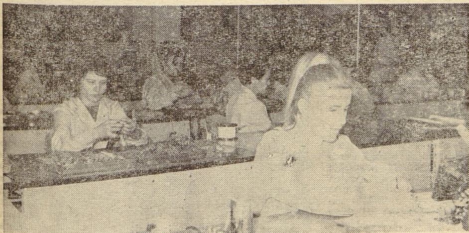
Osrednje prostore zagrebške ISKRA RIZ so pred nedavnim tudi adaptirali, tako da je proizvodnja sedaj tehnološko bolj urejena

Med odmorom prireditve je predsednik DS RIZ razdelil najzaslužnejšim v organizaciji ISKRA RIZ diplome in nagrade. Zlate ure je med drugim prejelo pet delavcev, ki so zaposleni v RIZ od ustanovitve. Marjan Kralj