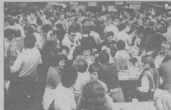
Stojšča ob mizah so najbolj poln prostor, so »restavracija« in tudi »čakalnica« za plesišče