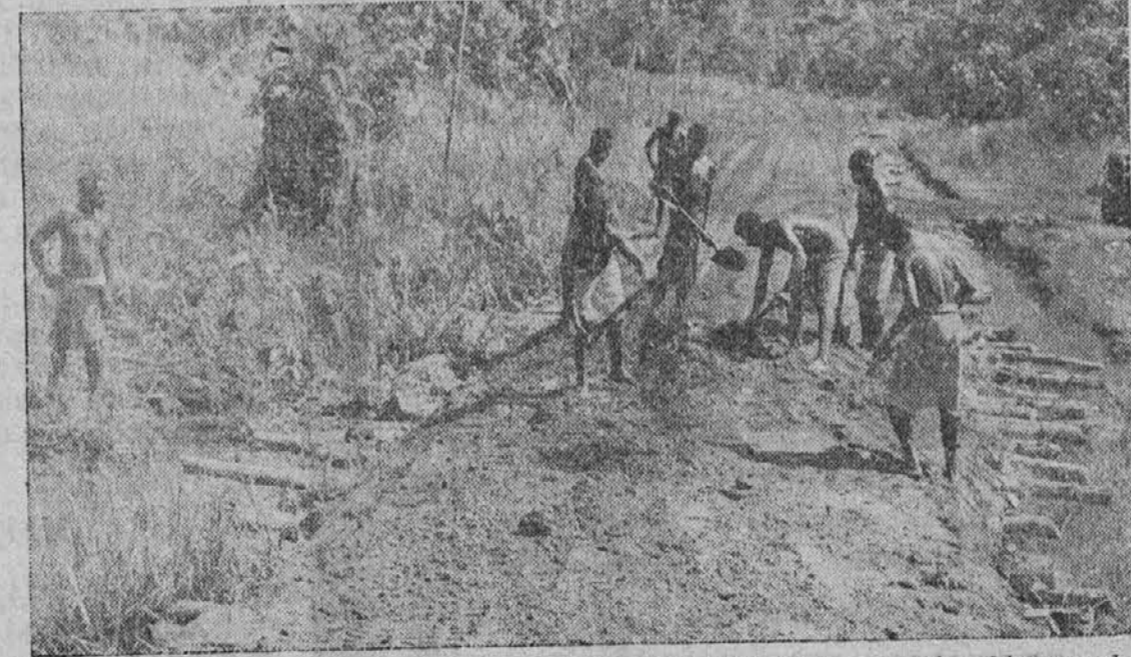
Na Novi Gvineji imajo kaj malo dobrih cest. Na sliki vidimo domačine, ki popravljajo po Amerikancih napravljeno moderno cesto, ki vodi v notranjost otoka. Ta cesta bo se- daj pripravljena za vsak promet in tako bo odstranjena ena ovira izmed stotine drugih ovir, s katerimi se morajo naši vojaki boriti v teh divjinah.