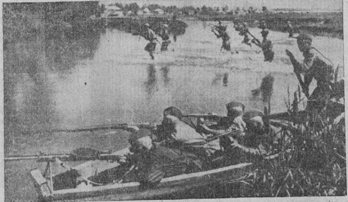
Ruski vojaki s pripravljenimi strojnica mi v čolnih krijejo napredovanje svojih to- varšev preko reke v Donets pokrajini, kjer se v zadnjem času vrše hudi boji. Gornje je radio slika iz Moskve.