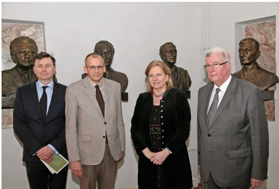
Avstrijska ministrica za zunanje zadeve dr. Karin Kneissl pred predavanjem na SAZU / The Austrian Minister of Foreign Affairs, Dr Karin Kneissl prior to her lecture at SASA