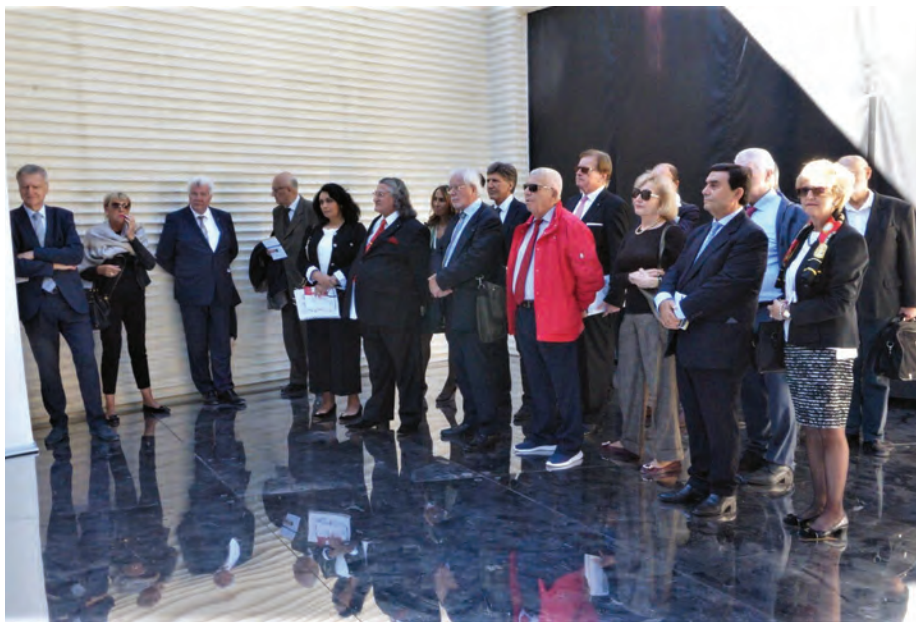
Vodstvo SAZU se je v Benetkah udeležilo predstavitve manifesta o prihodnosti Evrope ( Next Europe ). / Heads of SASA at the presentation of the manifesto Next Europe on the future of Europe .