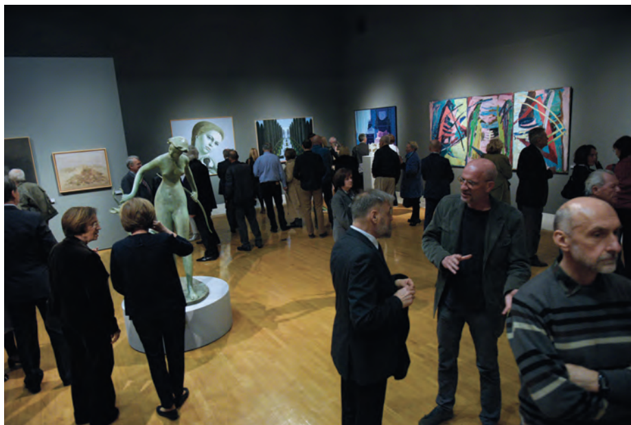
Razstava ob 80-letnici SAZU je bila na ogled od aprila do junija. / The exhibition marking 80 years of the Slovenian Academy of Sciences and Arts ran between April and June.