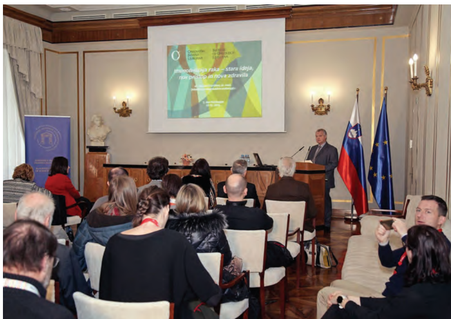
Tradicionalni Dan fiziologije na SAZU / Traditional Physiology Day at the SASA