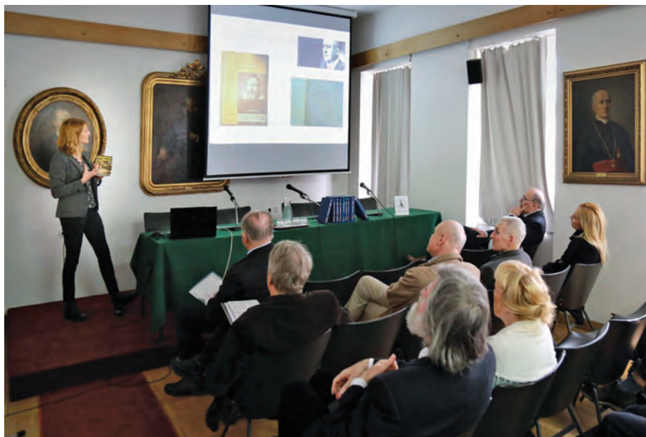
V soorganizaciji SAZU je bila na Slovenski matici okrogla miza o znanstveniku Milutinu Milankoviću. / In cooperation with SASA, the Slovene Society organised a round table on scientist Milutin Milanković.