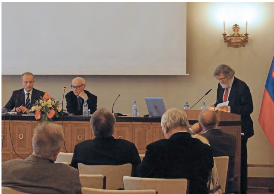
Simpozij Akademijski pogledi na Cankarja / The symposium Academy Visions of Cankar