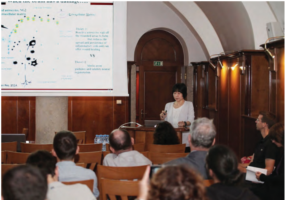
Mednarodni simpozij o nevrogliji / International symposium on neuroglia