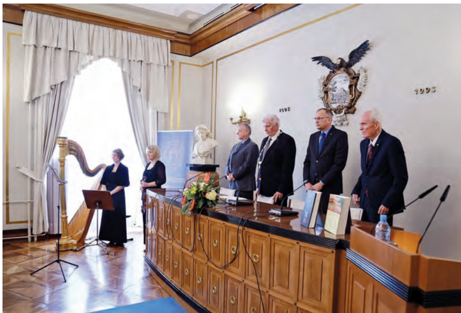
Slavnostna skupščina natanko 80 let po ustanovitvi SAZU, 12. novembra / The festive jubilee session on 12 November, exactly 80 years after SASA was founded