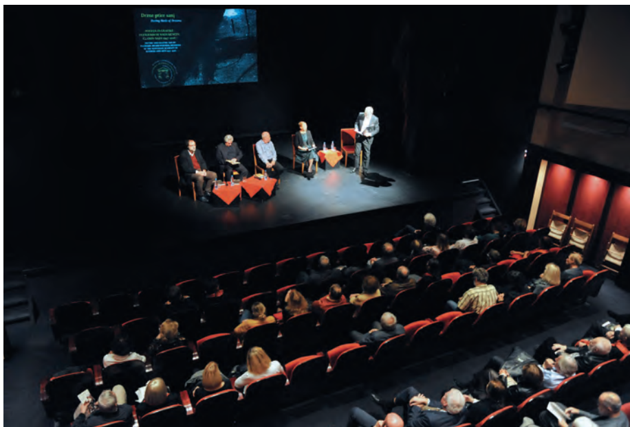
Odprtju razstave je v kranjskem gledališču sledil pesniški recital ... / The exhibition opening was followed by a poetry recital ...