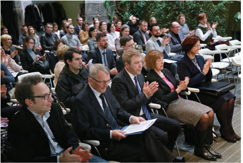
Dobro obiskani posvet Časovnost razlage zakona / The symposium on the Timeliness of Law Interpretation was well attended