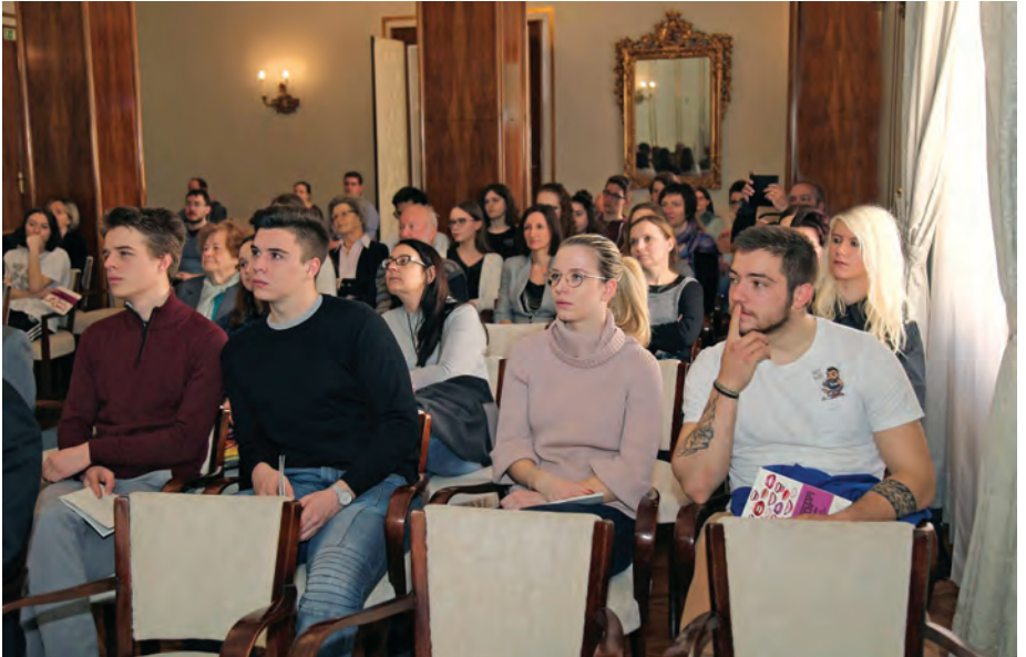
Na 2. srečanju mladih in SAZU na temo slovenskega jezika je bila dvorana polna dijakov. / Secondary school students interested in Slovenian language filled the Great Hall at the 2nd meeting of Academy Members with the young.