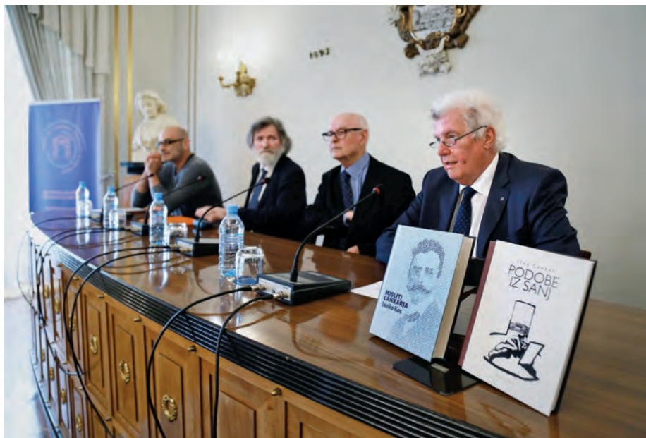
Predstavitve knjig ob stoletnici smrti Ivana Cankarja / Book presentation on the 100 th anniversary of the passing of writer Ivan Cankar