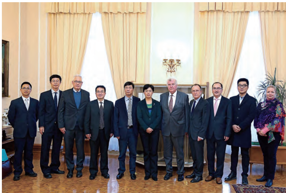
Obisk kitajske delegacije iz Nandžinga za sodelovanje na raziskovalnem in izobraževalnem področju / Visit of the Chinese delegation from Nanjing regarding mutual research and education cooperation