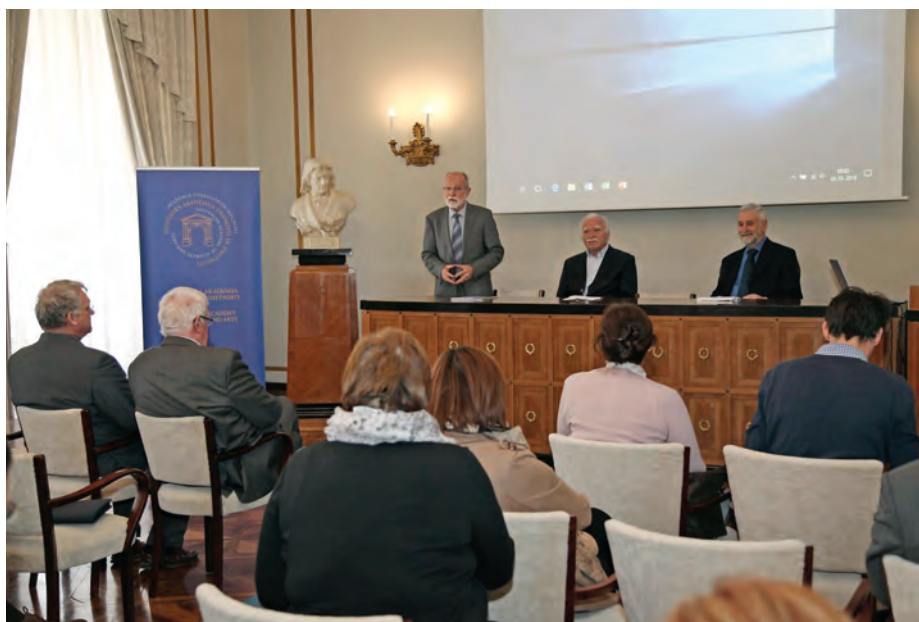
Na posvetu o prehranski varnosti so problematiko osvetlili s slovenskega vidika. / The Slovenian perspective on food safety-related issues was presented at the same name symposium.