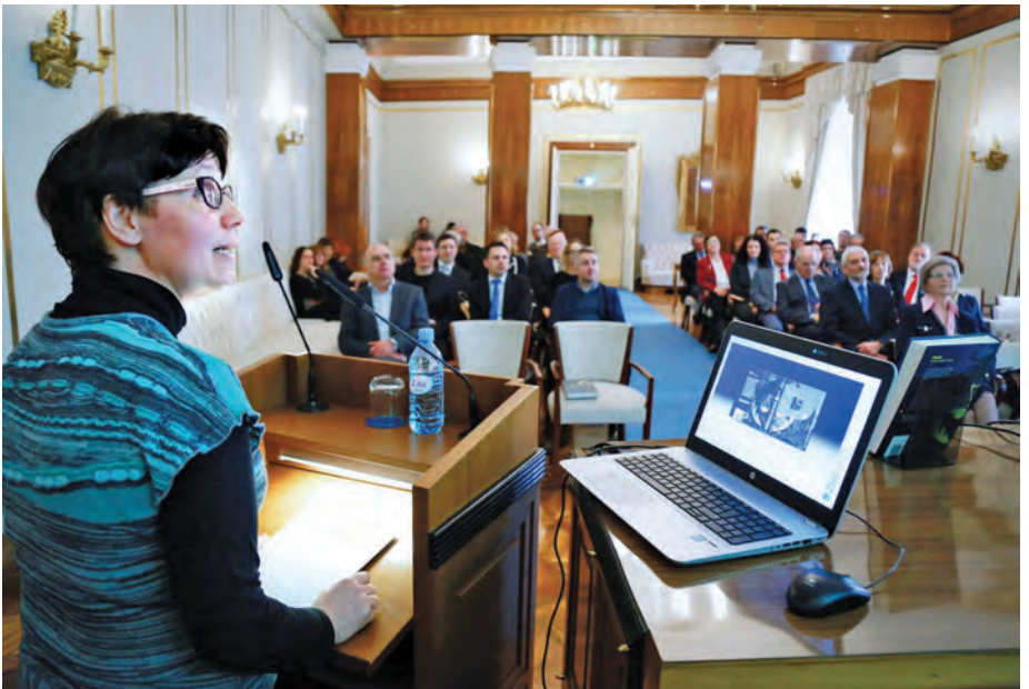
Predstavitve Pravnega terminološkega slovarja / Press conference to present the new Legal Terminology Dictionary in Slovenian.