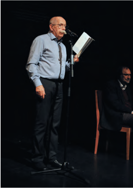
... z izrednim članom SAZU Milanom Deklevo, ... / with Associate Member, Milan Dekleva, ...