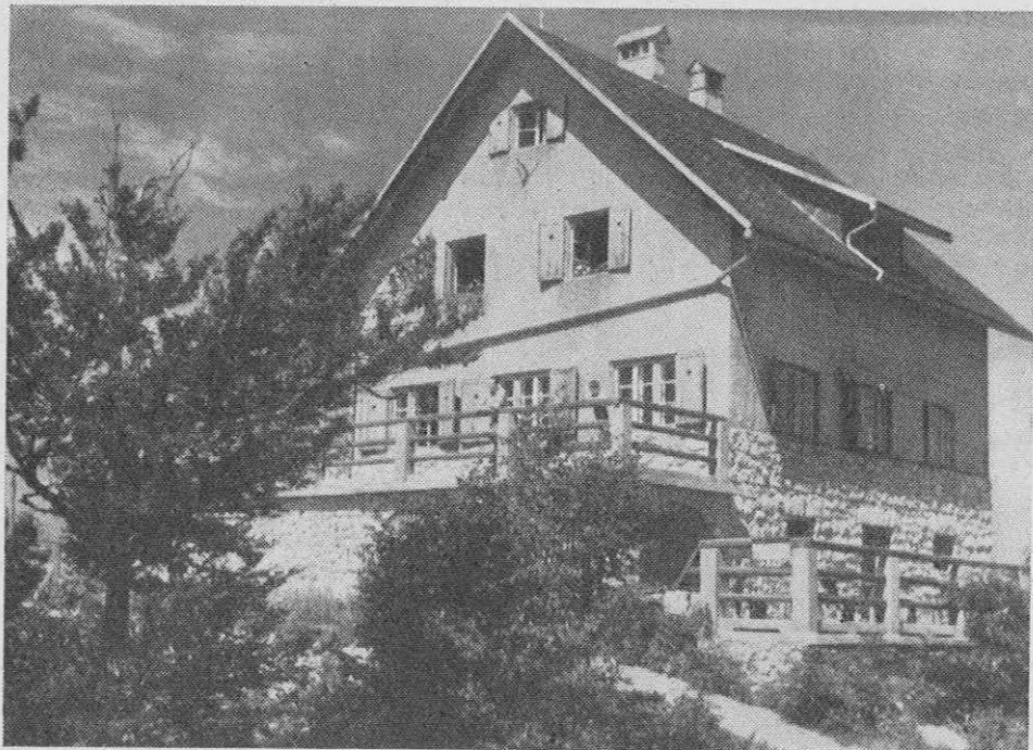
Dom na Lubniku (1027 m)

podjetja, obrtniki in privatniki v letu 1950 489 969.— din, v letu 1951 1 235 297.— din, v letu 1952 1 264 920.— din in v letu 1953 550 235.— din, torej skupno 3 720 150.— din.