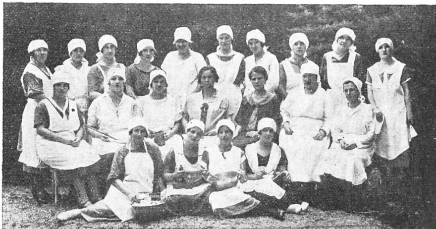
Gospodinjski tečaj „Društva slov. učiteljic“.