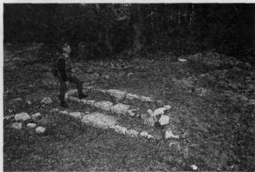
Na kraju, kjer je stala kapela Vršič, se danes v travi skrivajo le tri kamnite stopnice. V gozdu nekaj deset metrov za njimi je bilo nekoč tudi pokopališče avstro-ogrških vojakov, ki so med prvo svetovno vojno padli na Kalu (1698 m).

Ves čas vojne ob Soči je kapelo Vršič od vrha Kala in prvih italijanskih položajev na njem ločevalo le devetsto metrov zračne razdalje in petsto metrov višinske razlike. Še več, italijanski vojaki so jo iz svojih po-