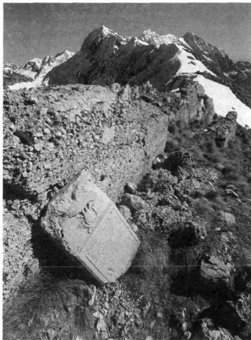
Napisna plošča italijanskega alpinskega bataljona Stelvio na vrhu Kala (1698 m). V ozadju se vidijo Vršič (1897 m), Krnčica (2142 m) in Krn (2245 m).