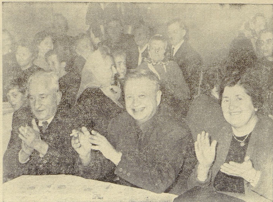
Kranjska tovarna beleži že nad 400 upokojujencev, zato ni čudno, da sta bili dvorana delavskega samoupravljanja in restavracija polno zasedeni. — Posnetek kaže skupino upokojujencev, ki navdušeno sprejema informacijo, da je »Elektromehanika« uspešno zaključila poslovno leto 1966

Brez sentimentalnosti lahko sestanek upokojujencev kranjske tovarne prištevamo k lepemu dogodku leta, ki v najjasnejši luči kaže, da upokojujenci s tovarno še vedno živijo, ker jo enostavno ne morejo pozabiti; bila je njihova drugi dom. Ado