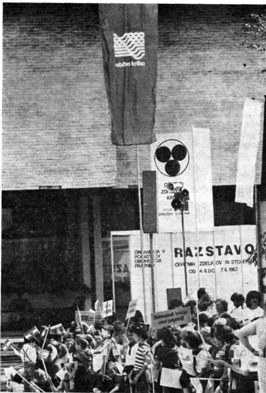
Ob prazniku občine so prvokrat zaplapolale tudi občinske zastave z belim znakom občine na zeleni podlagi.

V telegrafskem stilu torej: 3 lončarji, 3 cementnarji, 2 kleparja, 5 ključavničarjev, 4 izdelovalci kovinske galanterije, 4 izdelovalci kovinske galanterije in drobnih kovinskih predmetov, 1 strojni ključavničar, 2 kovinostrugarja, 3 strugarji, 5 avtomehanikov, 1 avtopralnica, 2 delavnici za demontažo, centriranje avtogum in vulkanizerstvo, 1 precizni mehanik za optične instrumente in optik, 1 urar, 7 avtokleparjev in avtoličarjev, 4 elektro-