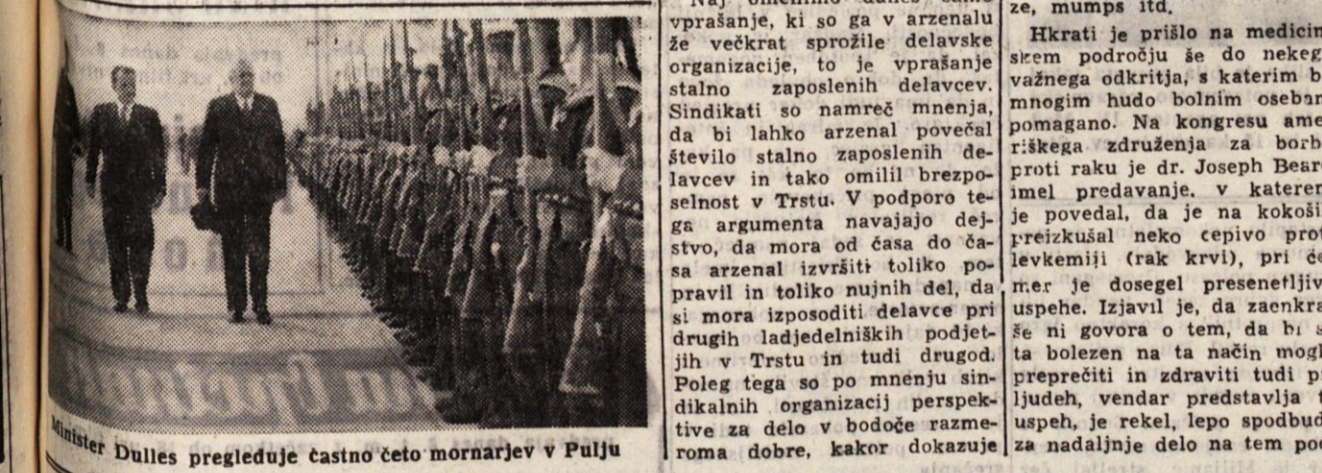
Minister Dulles pregleduje castno četo mornarjev v Pulju

Tržaški arzenal štiri leta nazaj je bil ustanovljen v Trstu. Danes zaposluje 1000 delavcev, v izrednih primerih pa do 1500. Arzenal je ustanovljen leta 1853 in je bil takrat prava ladjedelnica. Leta 1865 so splovili prvo ladjo. Takrat pa do leta 1912, ko je prenehal biti ladjedelnica, je zgradil 134 ladij s skupno 25.620 tonami. Danes se peča v glavnem s popravili, preureditvami in reklasifikacijo ladij. Arzenal je bil ustanovljen leta 1853 in je bil takrat prava ladjedelnica. Leta 1865 so splovili prvo ladjo. Takrat pa do leta 1912, ko je prenehal biti ladjedelnica, je zgradil 134 ladij s skupno 25.620 tonami. Danes se peča v glavnem s popravili, preureditvami in reklasifikacijo ladij.