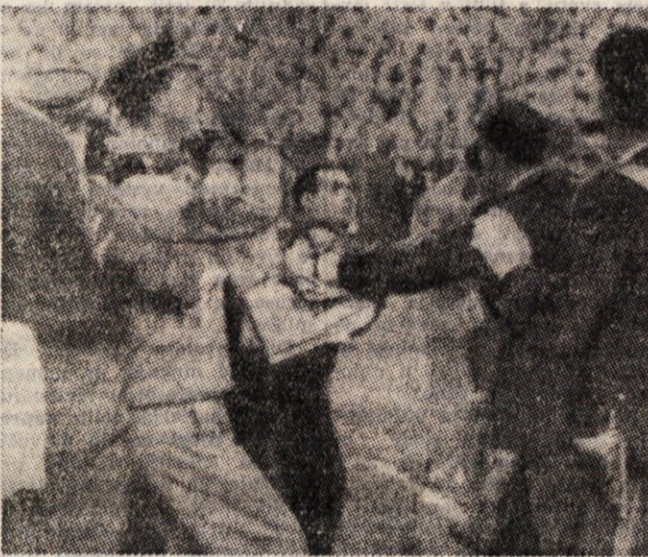
Ali bomo odslej objavljali take slike z nogometnih igrišč? Ta slika je bila posneta takoj po tekmi Napoli-Bologna v Neaplju. Zaradi prejetih poškodb je potrebovalo zdravniške pomoči kakih 20 civilnih oseb, v bolnicah jih je devet, od teh pet agentov JV. Med varnostnimi organi je bilo ranjenih 34 agentov JV, 3 castniki in 15 karabinerjev. Stevilo vseh ranjenecv znaša 152.

Čeprav smo skoraj šele na začetku prvenstva, pa se nam že zdi, da postaja borba za obstoj v prvi ligi skorajda dramatična. Tak vtis sta nam vsaj ustvarili Triestina in Pro Patria, ki sta se sešli v Trstu.