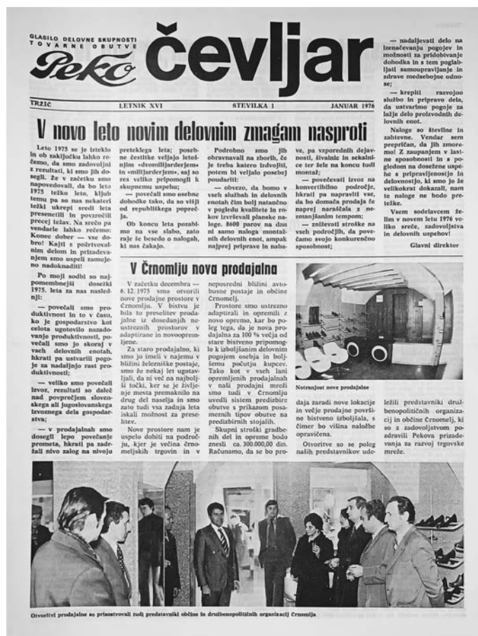
Naslovnica glasila Čevljar

Kot že omenjeno, sem se pri analizi glasila osredotočila na pridobivanje znanja. Pri načinih pridobivanja znanja ločimo med izobraževanjem in učenjem ter naprej med formalnim in neformalnim izobraževanjem. Izobraževanje je ciljno usmerjeno, praviloma uradno, opredeljeno s cilji, strukturirano in organizirano od zunaj. Je strokovno organizirano in nadzorovano, praviloma s poukom in učiteljem. Učenje je širši pojem. V ospredje postavlja posameznika, je vseživljenjsko, temelji na lastni dejavnosti, poteka povsod, vsebine se prepletajo in niso načrtno usmerjene. Izobraževanje je eden od načinov učenja. Formalno izobraževanje pripelje do formalno potrjenih izobraževalnih rezultatov, kot so dosežena stopnja izobrazbe, diploma, poklicna kvalifikacija, medtem ko je neformalno tisto, ki ni namenjeno pridobivanju formalnega izkaza, kot so spričevalo, diploma, priznanja ipd. 26 Prispevke, ki sem jih analizirala, sem glede na vsebino razdelila na dva sklopa. Prvi sklop zajema prispevke, ki bralca o nečem poučujejo. Pišejo o zgodovini podjetja, tehničnem razvoju, boju proti boleznim, alkoholizmu in dajejo raznorazne uporabne nasvete. Drugi sklop zajema prispevke, ki so vezani na izobraževanje zaposlenih in prihodnjih zaposlenih. Pišejo o podeljenih štipendijah, institucionalnem šolstvu, izobraževanju ob delu, poročajo