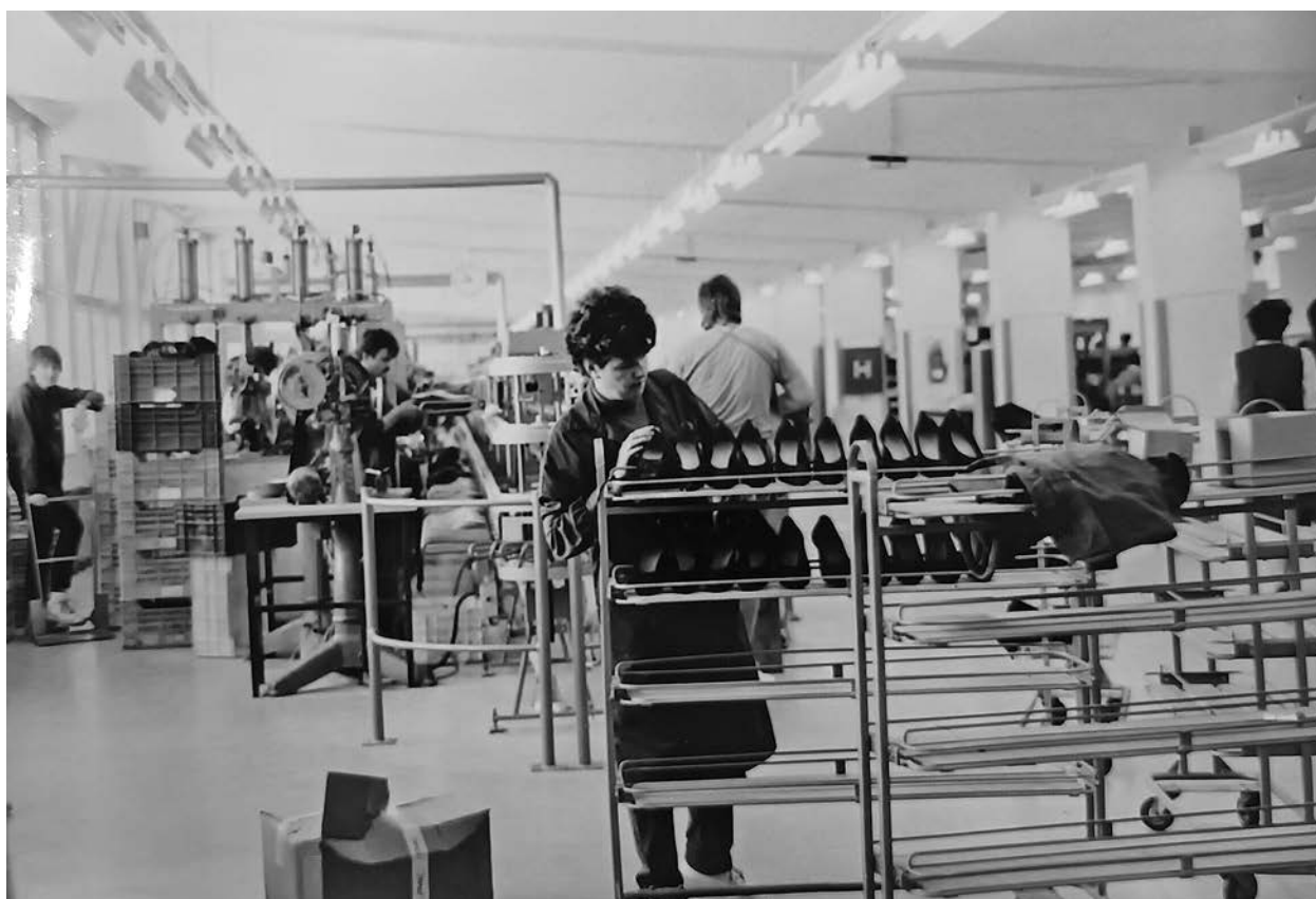
Proizvodnja v tovarni Peko Tržič leta 1989 (Vir: SI_ZAL_TRŽ/0038, Peko Tržič, t. e. 171, p. e. 947)

V prvih prispevkih so avtorji želeli osvetliti težave z alkoholizmom. Po podatkih iz leta 1963 in 1964 je bila Jugoslavija takoj za Francijo in Italijo največja porabnica alkohola na prebivalca. Poleg zdravstvenih težav, ki jih prinese alkoholizem, slednji močno vpliva tudi na delovno sposobnost. Institucionalno se je zdravstvo z alkoholizmom začelo ukvarjati šele po letu 1960. V prispevkih so predstavljeni simptomi alkoholizma, kako ga je možno pozdraviti ter katere bolezni in duševne motnje prinesejo težave z alkoholizmom. 74 Podani so bili tudi nasveti, kako prepoznamo alkoholika in kako mu lahko pomagamo. 75 V skoraj vsaki nadaljnji številki je bilo objavljeno pričevanje zaposlenih v Peku o spopri-