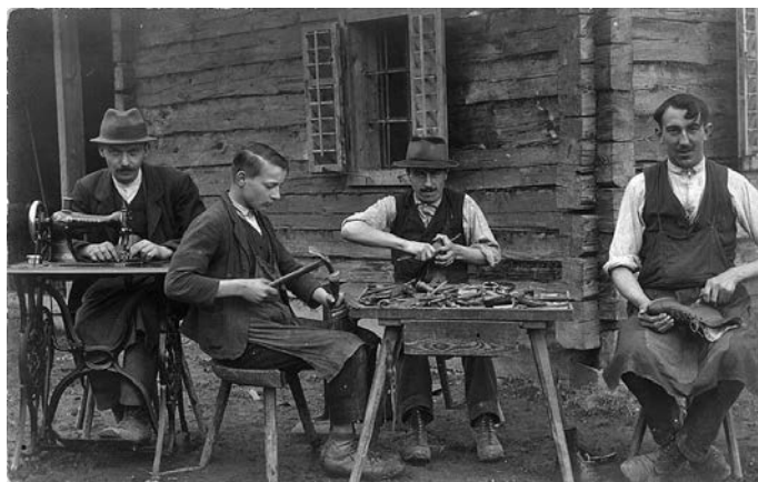
Čevljarji na razglednici iz leta 1914

Uredništvo je želelo bralcem predstavljati, kako delujejo kreativni oddelki podjetja. Tako naletimo na prispevke, ki predstavljajo nastanek kolekcije, vse od analize potrebe na trgu, obiska nakupovalnih središč večjih tujih mest, obiska modnih sejmov do izdelave predlogov, prototipov in pomerjanja čevljev. 35 Modelirji Peka so se povezovali tudi v tuja združenja. 36