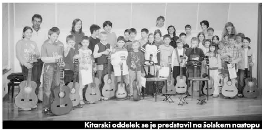
Kitarški oddelek se je predstavil na šolskem nastopu