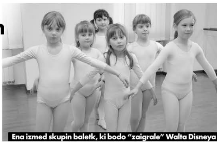
Ena izmed skupin baletk, ki bodo "zaigrale" Walta Disneya

V duhu zblíževanja in sodelovanja med slovenskimi in italijanskimi ustanovami ter v čezmejnem prostoru so se mladi instrumentalisti Centra Komel tudi letos pridružili Orkestru mladih (Orchestra dei ragazzi), ki je 30. aprila in 1. maja zaigral v parku na Kornu pro-