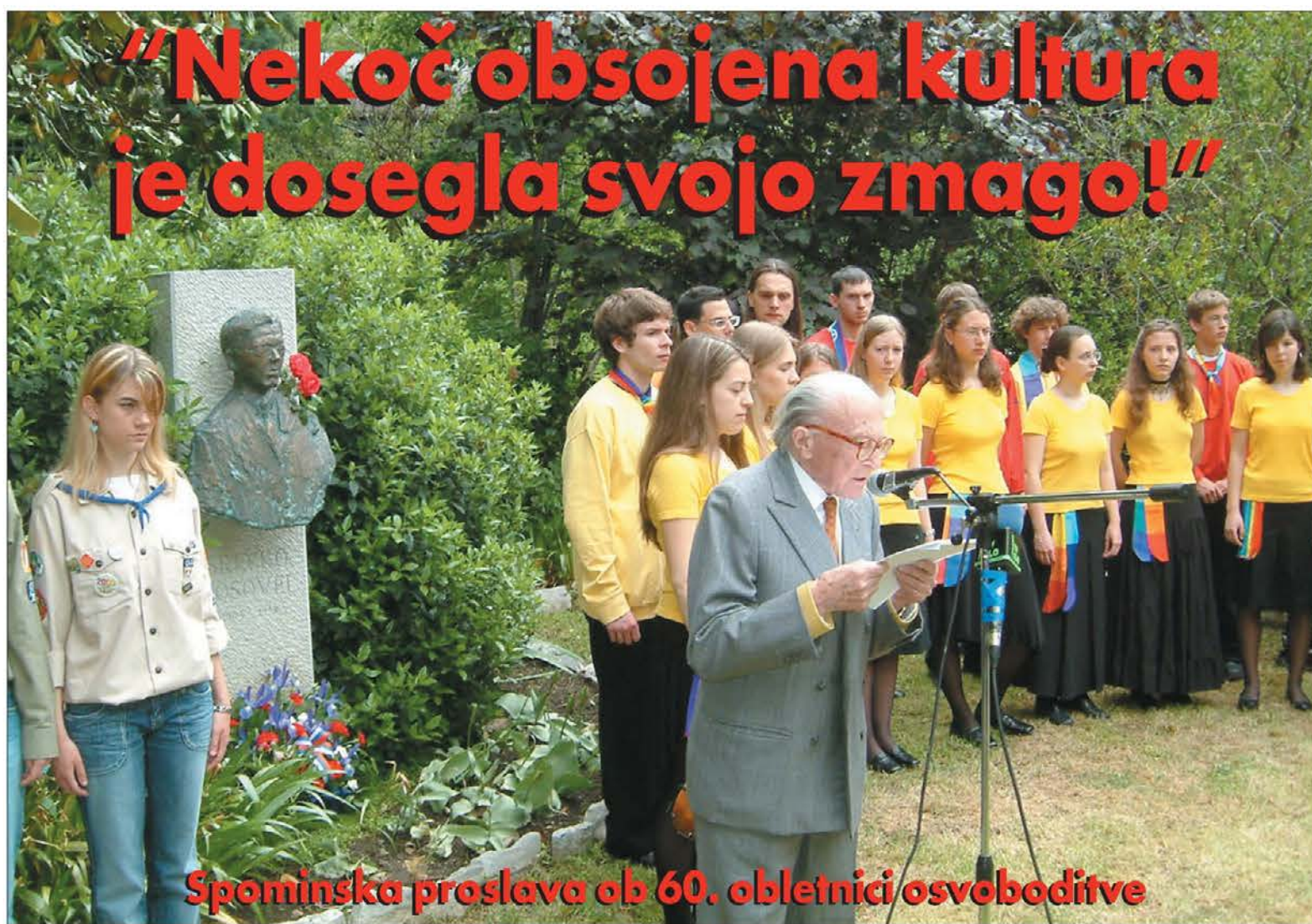
Spominska proslava ob 60. obletnici osvoboditve

Škoda, ker nismo sposobni sami v svojih vrstah doseči tiste enotnosti v različnosti, o kateri vedno samo govorimo, a bi, če bi jo dosegli, vsem nam omogočila, da bi se čutili del neke skupnosti, bi nam omogočila, da bi živeli kot skupnost, česar pa danes, žal, za nas ne moremo reči! Škoda!