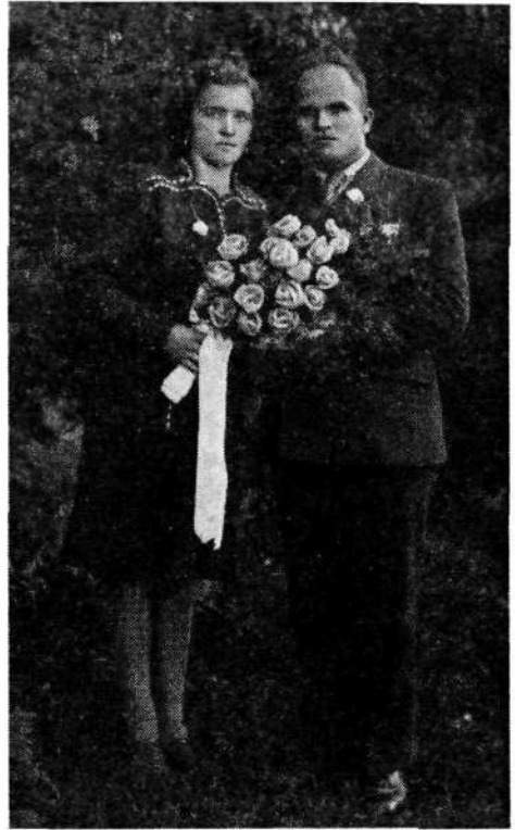
Poročni šopek: kombinacija belih povoskanih vrtnic in svežega asparagusa. Novoporočenca imata na prsih tudi svatovski nageljček iz papirja. Foto iz let okrog 1950 je last Justine Primožič

nice in nageljčke, je iz škrniceljnov oblikovala šopke za neveste. Še po toliko letih jo katera pohvali: Ko ste mi pa tako lep šopek naredili za poroko.