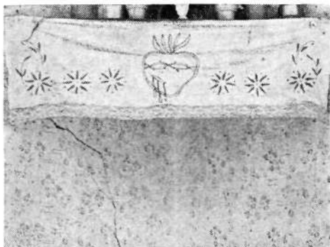
»Bohkov kot« so svojčas navadno krasili prtički z ustrezno motiviko. Tale na sliki je iz tridesetih let.