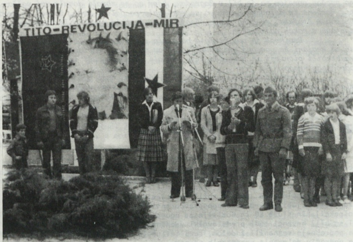
Pogled na svečani sprejem zvezne štafete mladosti na Adamičevi ploščadi v Grosupljem.

ZA 27. APRIL - DAN USTANOVITVE OF, DELAVSKI PRAZNIK 1. MAJ IN 25. MAJ DAN - MLADOSTI