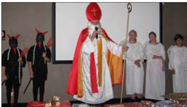
Miklavž z angeli in parklji.