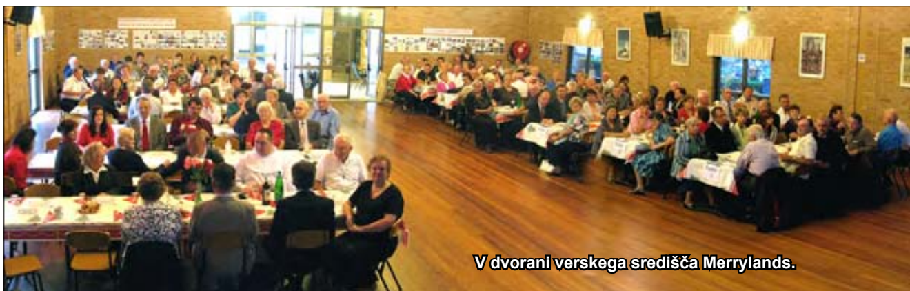
V dvorani verskega središča Merrylands.