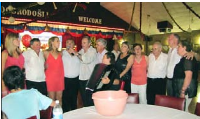
Veselo v klubu Jadran na Silvestrovo.