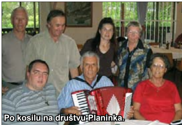
Po kosilu na društvu Planinka.