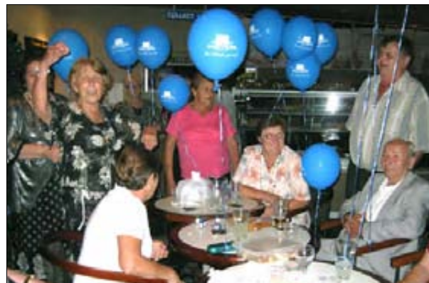
Vesela družba na silvestrovanju v Triglavu.