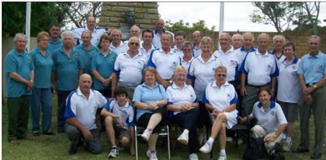
Tekmovalci za Cankarjev pokal.

Na Miklavževo nedeljo v decembru 2009 se je v Klubu Triglav zbrala množica otrok v pričakovanju dobrototnega svetnika s košem daril. Medtem, ko so čakali, so jim odborniki kluba postregli z BBQ kosilom, otroci so se igrali z ovčicami, kozicami, zajčki in drugimi domačimi živalmi, zabaval jih je čarovnik, poslikali so jim obraze z rožicami in