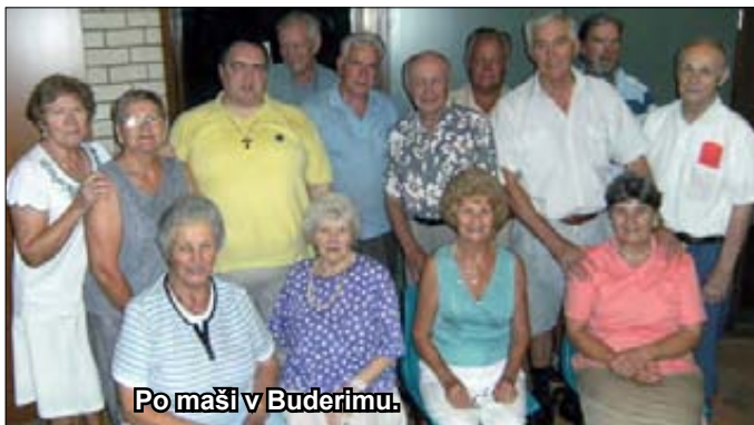
Po maši v Buderimu.