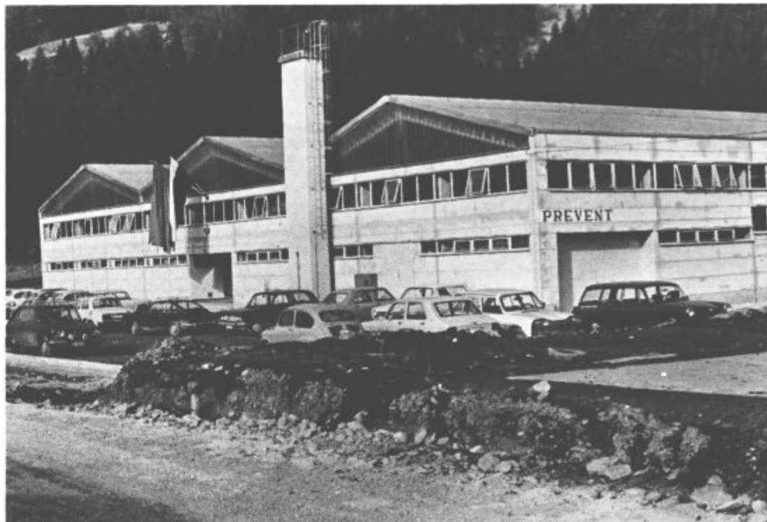
Delovna skupnost industrije delovnih zaščitnih sredstev Prevent Slovenj Gradec je prejšnji petek slavila novo delovno zmago. Svojemu namenu so predali nove prostore za slovenjgraški obrat zaščitnih sredstev in usnjene konfekcije. — Več o tem pomembnem dogodku poročamo na slovenjgraški strani.