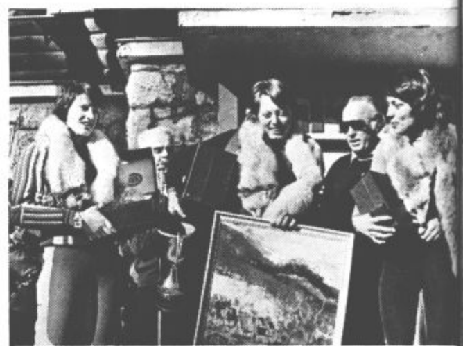
JAHORINA - GOSTITELJICA EVROPSKIH SMUČARJEV - Na zasneženih planjavah Jahorine so se pomerili najboljši evropski smučarji. Prvega dne so se pomerili moški v smuku za pokal Jahorina 75, drugega dne pa ženske veleslalomu za „zlato lisico“. Na posnetku so tri najboljše tekmovalke, s trofejami lisicjih kož okrog vratu.