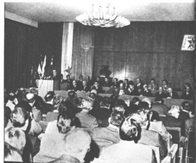
POL STOLETJA IZHAJA KOMUNIST - V Beogradu je svečana seja odbora ob jubilejni obletnici izhajanja Komuniste. Proslavljanje tega pomembnega jubileja bo trajalo skozi vse leto, pokroviteljstvo nad tem pomembnim jubilejem pa je prevzel predsednik ZKJ Josip Broz Tito.

V Partizanskem domu pod Malo Kopo na Zahodnem Pohorju je bila zadnji petek, 24. januarja, 34. seja izvršilnega odbora slovenjegraške podružnice Ljubljanske banke. Na seji so obravnavali poročilo o likvidnosti ter o delu obeh kreditnih komisij, odobrili so več kratkoročnih in stanovanjskih posojil ter soglašali s predlogom pravilnika o posojilih občanom na podlagi vezave domače ali tuje valute za pospeševanje gospodarskih dejavnosti.