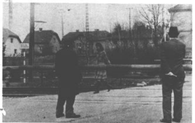
Kljub temu da je vlak pred dnevi v Šoštanju do smrti povozil pešca, ki je prečkal progo, ko so bile zapornice zaprte, pa kaže, da nekateri Šoštanjčani še vedno tekmujejo z vlakom.