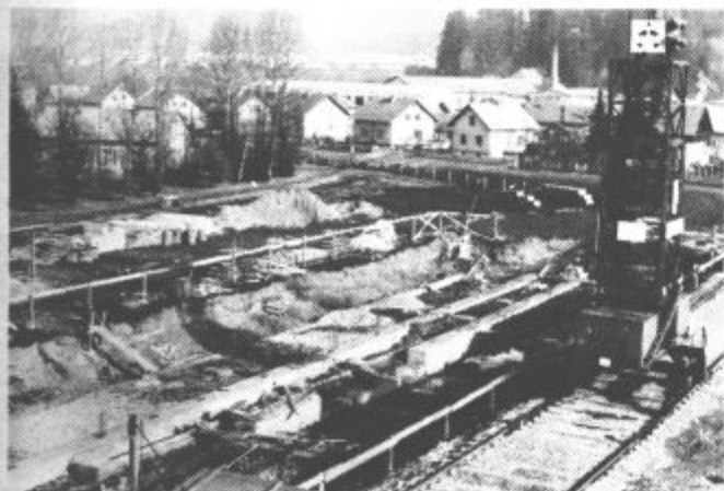
Gradbišče novega Zdravstvenega doma Slovenj Gradec. Novi prostori bodo predstavljali pomemben mejnik v razvoju osnovne zdravstvene službe v Mislinjski dolini.