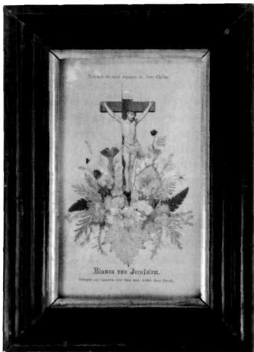
Spominek, cvetje s Kalvarije in Kristusovega groba, ki se nahaja v starološkem župnišču, so prav verjetno prinesli iz Jeruzalema hvaležni prifarški romarji.