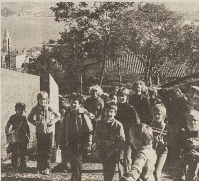
SPDT se je vedno zelo posvečalo našim najmlajšim - utrinek z izleta po miljskih hribih

Leta 1977 je predsedniško mesto prevzel inž. Pino Rudež. Društvo je vodil do 1985, ko je "predsedniško štafeto palico"