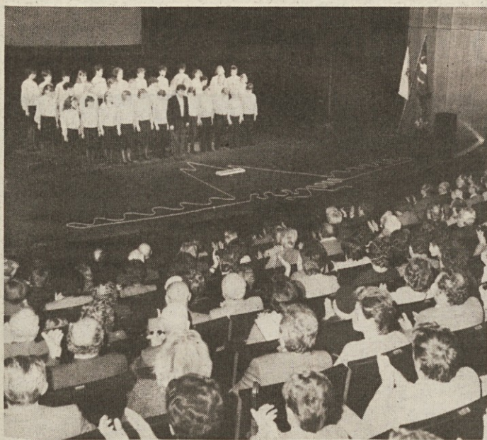
Proslava 80-letnice SPDT v Kulturnem domu v Trstu leta 1984

Slovensko planinsko društvo iz Trsta praznuje letos svojo 85. obletnico obstoja. Člani in prijatelji društva se še živo spominjajo slavnostnega praznovanja 80-letnice, ko že trka na vrata naslednja, sicer manj okrogla, a zato nič manj pomembna obletnica. SPDT se je odločilo, da jo proslavi delovno, brez velikega zunanjskega bleska, kakor je njegovo delo večkrat zakrilo in skromno, vendar pa trdoživno, vztrajno in se v času tudi obrestuje. SPDT se je znalo v tem svojem zadnjem obdobju obnavljati, zato pa imamo pred sabo zdravo, optimistično, delavno in sveže društvo, ki sezaveda svojega poslanstva. SPDT bo slavilo svojo 85. obletnico danes na vrhu Poldanjsnje špice nad Zajzero, kjer bo opoldne krajša slovesnost s krajšim govorom in nastopom TSF Stu ledi. Proslava se bo nato nadaljevala v popoldanskih urah (ob 17.00) v Domu Mangart v Žabnicah, kjer bo uradni del slovesnosti z nastopom pevskega zbora iz Ukev.