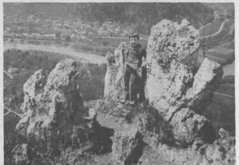
Prava spominska fotografija kot z visokih gora. Pa je le narejena sredi Grmade.