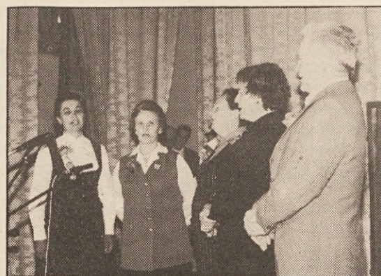
Ljudski pevci iz Dul in Potoč pri Šmohorju