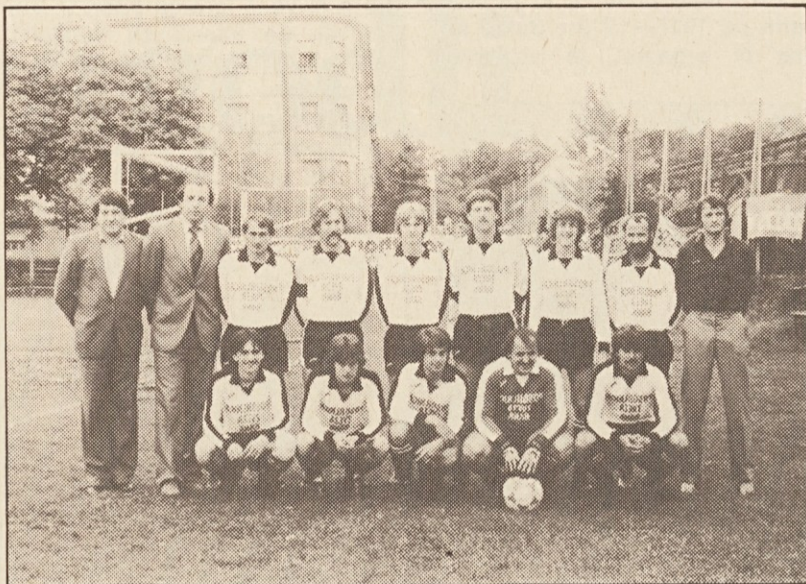
Zadnja tekma se je končala kot vse tekme na Košatovem igrišču v vigredni sezoni z neodločnim rezultatom.

deli, kaj jih čaka, ako izgubijo sobotno tekmo proti SAK-u. Gostujoči klub je prav gotovo slabši od SAK-a, zato so Kotmirčani hoteli zmagati na drug način: vsi so se borili kolikor je bilo v njihovih močeh in tre-