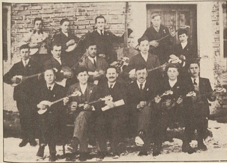
Med drugim smo videli na razstavi sliko o bilčovski tamburaški skupini, ki je nastopala v občini in okolici v letih 1935–1938.

Razstava je bila dobro obiskana in je predvsem predstavila ljudi pri delu doma in na polju, nekdanjo podobo pokrajine, kulturno dejavnost v občini ter gasilsko društvo.