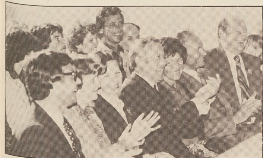
Imenitnim gostom je prireditelj zelo ugajala