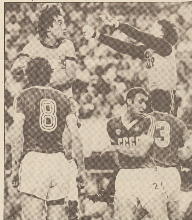
Odlično je branil svoja vrata sovjetski vratar Dazajev, Zico je tokrat bil prepozen. Kljub temu je Brazilija s pomočjo pristranskega sodnika premagala Sovjetsko zvezo z 2:1.