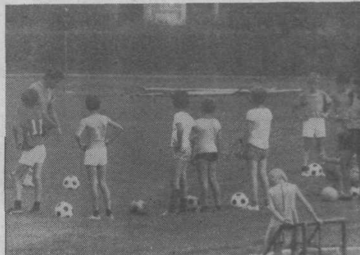
Dobimo se v športnem parku Kodeljevo