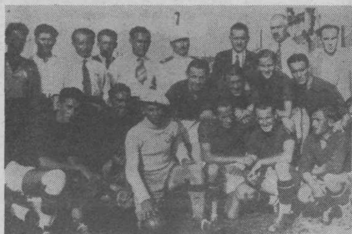
Nogometno društvo Slovan leta 1934

iz Peči. Tekma bo ob 15.00 uri v športnem parku Kodeljevo. Če bodo domačini zmagali, kar je seveda nemogoče, bi bil to največji uspeh mladih Kodeljevčanov. Zato jim želimo čimveč športne sreče. M. T.