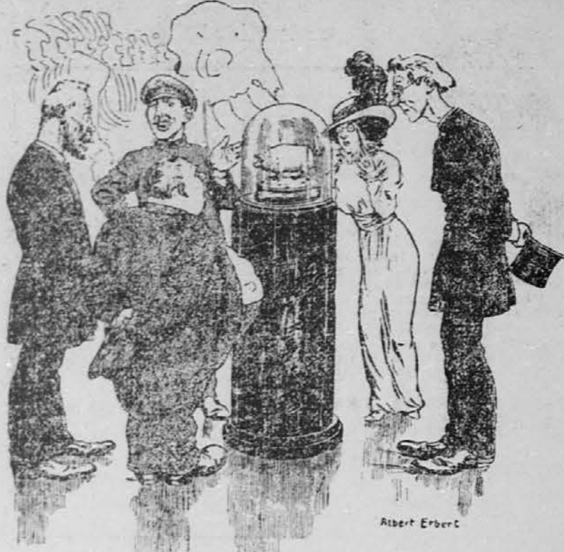
V muzeju 1930: "Tukaj gospoda, vidite neko žival, katera je bila pred 25 leti glavno hranilno sredstvo vsemu človeštvu. Rad bi vam jo pokazal živo, toda postala je tako silno draga, da si jo ne moremo nabaviti."