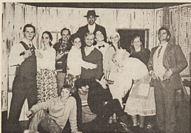
Gledališka skupina Slovenske vasi po zadnji predstavi na turneji v Sloveniji z igro "Barka brez ribiča".