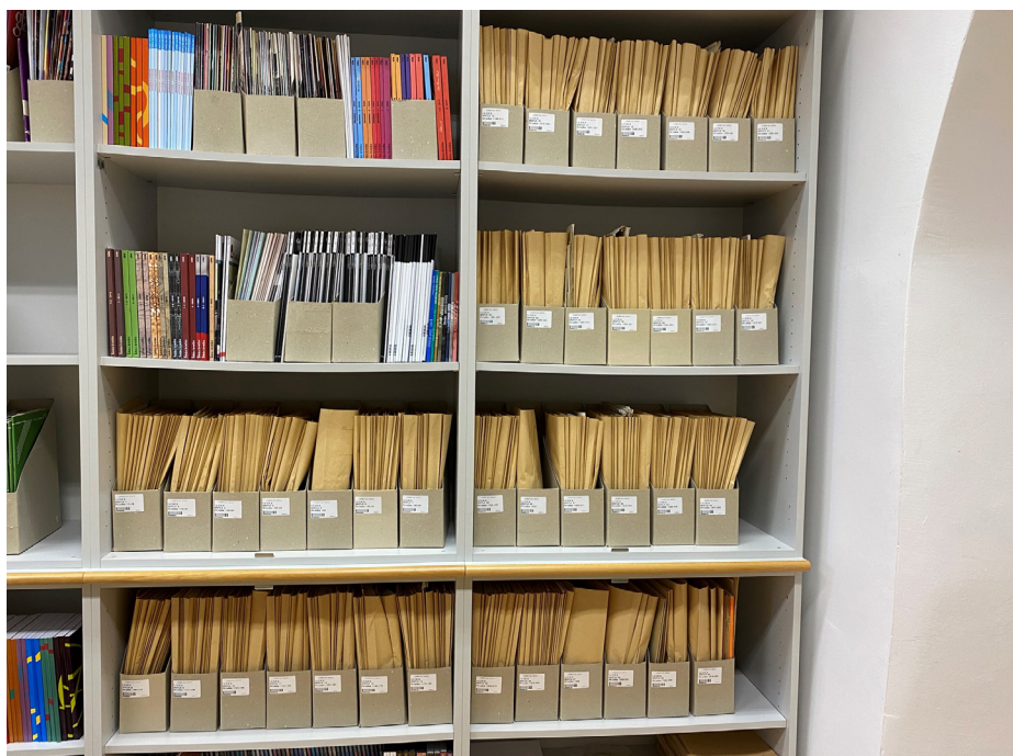
Slika 1: Notni arhiv Ženskega pevskega zbora Miko Škoberne Jesenice v knjižnici na Glasbeni šoli Jesenice (v ovojih in škatlah, na katerih je nalepka)

V pravilih za bibliografsko obdelavo rokopisnega gradiva in zapuščinskih fondov v slovenskih knjižnicah v sistemu COBISS (Rokopisno gradivo, zapuščinski fondi in tvorjene zbirke, 2021) je zapisano, da najprej določimo osnovno strukturo fonda. V našem primeru smo se odločili, da bomo zapuščinski fond razdelili po skladbah ter znotraj skladb po naslovih. To smo storili zato, ker je pri skladbah pogosto, da izidejo v različnih priredbah in zato naslov skladbe igra pomembno vlogo. Hierarhična delitev v našem primeru ni bila potrebna. Notni arhiv ŽPMŠJ je prikazan na Sliki 1.