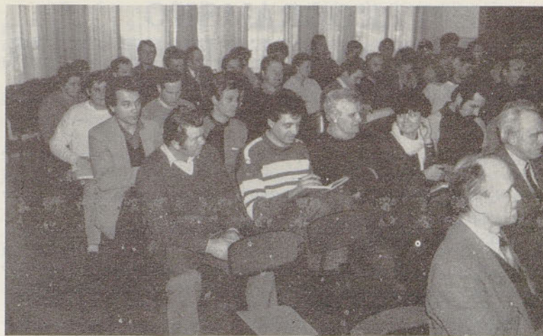
Udeleženci sindikalne konference

– Nerešeno je ostalo vprašanje ureditve oz. razrešitve problema doma na Svetini.