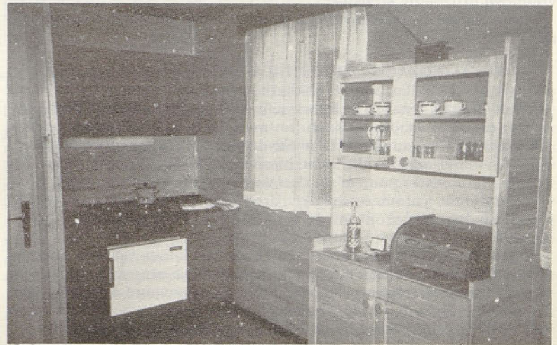
Notranjost našega bungalova v Čateških topličah

Zimsko letovanje ima to slabo stran, da je bazen, kamor se hodiš kopat, oddaljen 10 minut peš hoje in če nimaš avtomobila, se pri nizkih temperaturah težko odločiš za kopanje v bazenu. Že res, da je termalna voda napeljana v kopalnično kad, toda trenutno še kopalnica ni bila ogrevana in 30 °C, kolikor ima termalna voda, ti ne daje nobenega poželenja, da se kopaš doma. V zdraviliškem domu ima voda v bazenu 37 °C in če si v njej uro ali več, ne moreš tako »prekuhan« oditi ven in domov, ampak se mo-