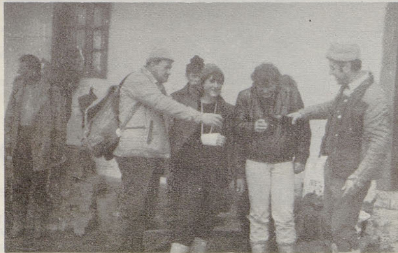
Naši udeleženci pohoda