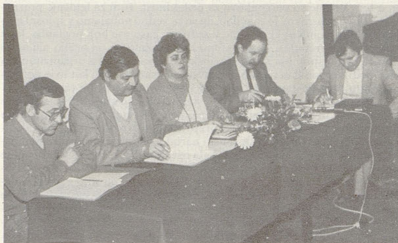
Delovno predsedstvo letne sindikalne konference

V celoti tudi nisem zadovoljen z sodelovanjem pa tudi aktivnostjo mladine v Železarni Štore.