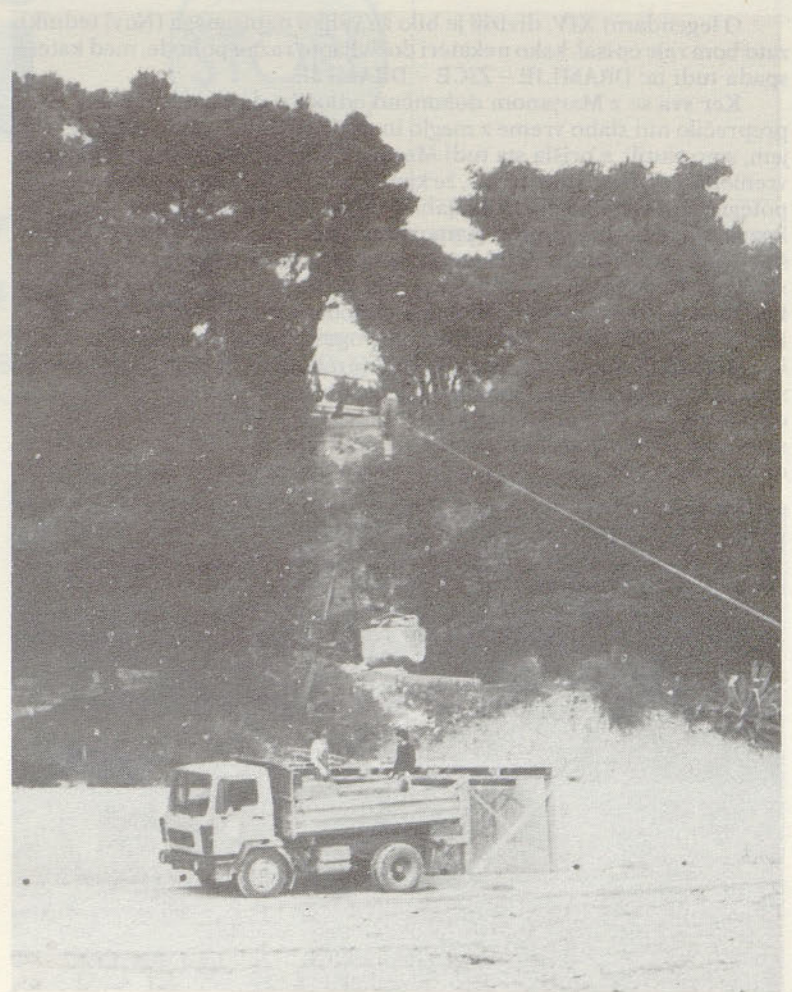
Žičnica glavna prometna žila