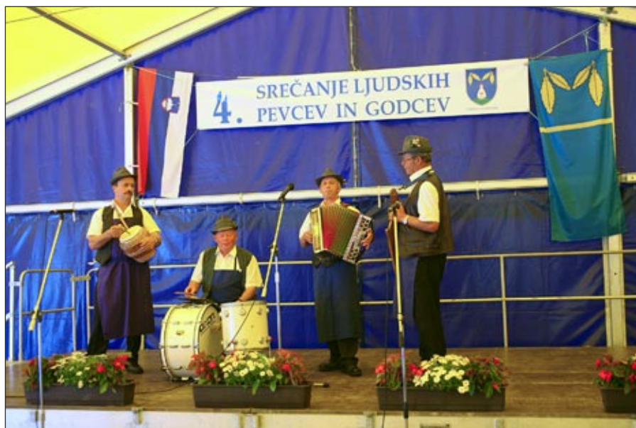
Na srečanju na Ptujski Gori je zaigrala tudi Stoperška banda

Že po tradiciji se ob koncu meseca junija na Ptujski Gori srečujemo ljubitelji ljudskega petja. Ljudska pesem združuje v sebi vse, kar premoremo: v njej so skrite izkušnje naše preteklosti, modrost naše sedanjosti in želje naše prihodnosti. Z ljudsko pesmijo in tistimi najbolj tipičnimi slovenskimi prepoznavnimi simboli smo si naredili lepo popoldne v soboto, 26.6.2010. Organizatorji prireditve – Društvo upokojencev Ptujška Gora, TD Ptujška Gora in PGD Ptujška Gora – so k petju povabili domačinke Ljudske pevke DU Ptujška Gora, ljudske pevce Društva upokojencev KD Grajena s frajtonarjem, Prešmentane falote KPD Stoperce, ljudske pevce FD Rožmarin Dolena, ljudske pevke iz Stoperc, ljudsko pevsko skupino Taščica KD Rače, pevke Ptujške upokojenke DPD Svoboda Ptuj, ljudske pevce DU Videm, podgorske vaške pevce DU Podgorci, ljudske pevce DPD Svoboda Pragersko, kvartet Slavček in Stoperško bando. Slišali smo številne zanimive ljudske pesmi, ob nekaterih smo se tudi prav prisrčno nasmejali. Pred pričetkom pevskega programa smo k besedi povabili županjo