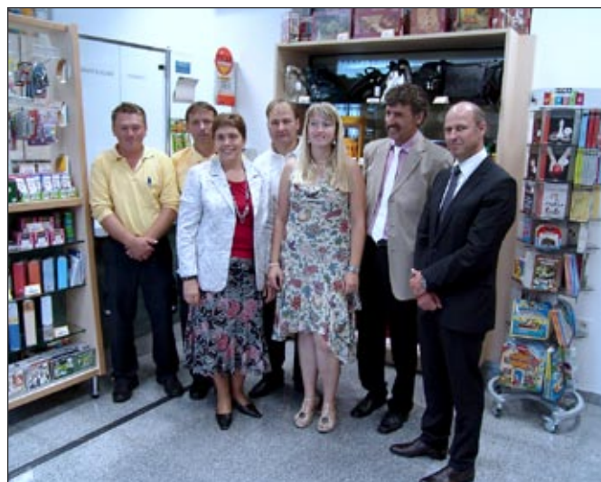
Kolektiv pošte Majšperk z direktorjem PE Maribor