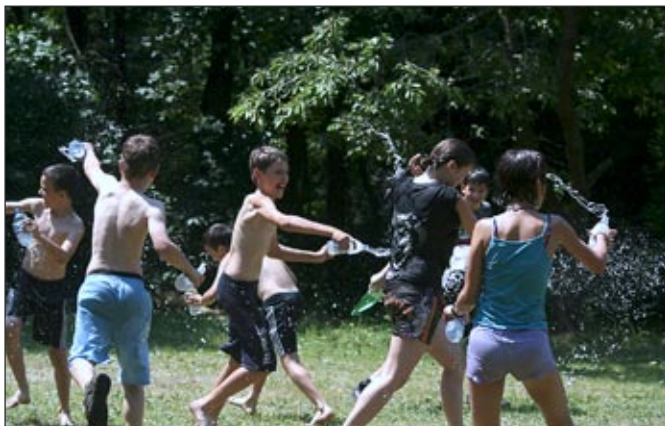
Ko je vroče, prija ohladitev...

Spali smo v šotoru, čeprav je bilo trdo. Igrali smo se igro skriti prijatelj. Imeli smo pohod na Bolfenk in orientacijski pohod ter kviz. Špricali smo se z vodo, da smo bili mokri do kože. Razdeljeni smo bili v tri skupine: Winettu, Metallica in Planinci. Morali smo pomivati posodo. Bilo je fajn.