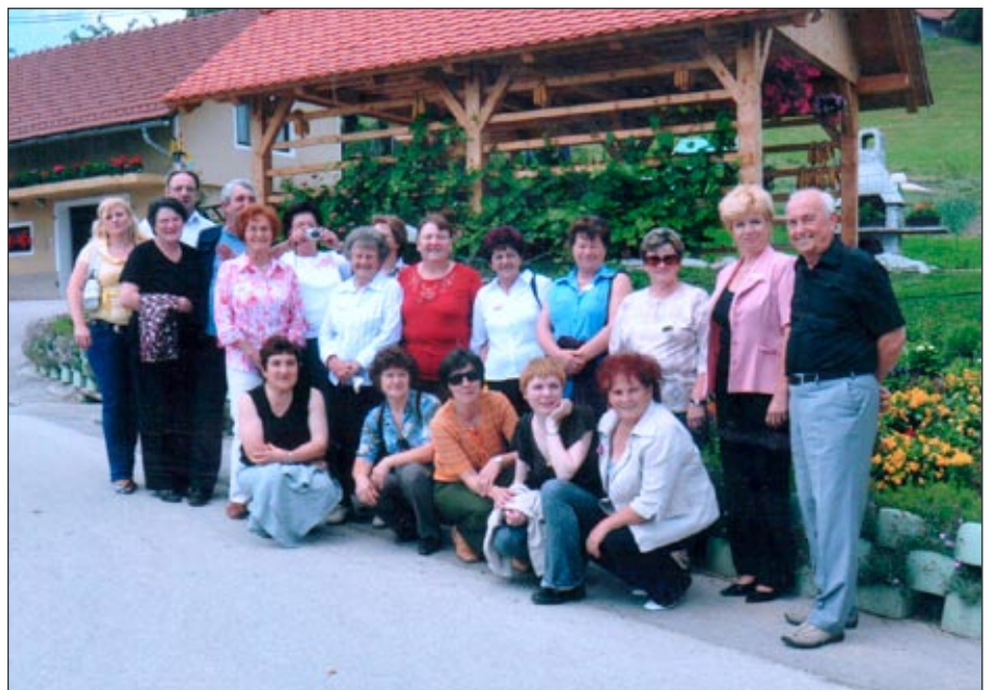
»Gasilska« z izleta

Krajevna skupnost Galicija leži na severovzhodnem delu občine Žalec in meri dobrih 18 kvadratnih kilometrov. Ima