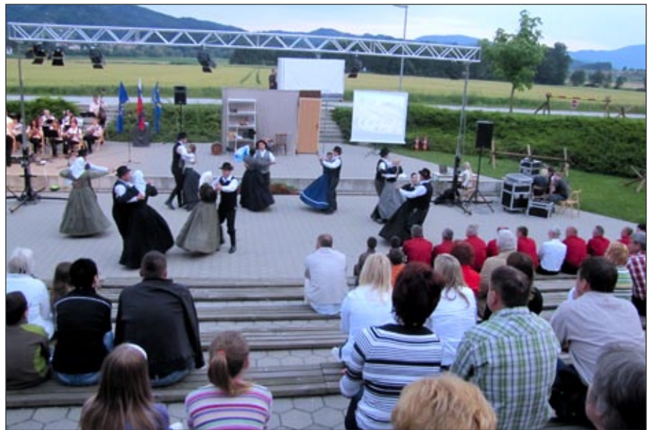
Utrinek z osrednje občinske prireditve

Tako kot vsako leto se je tudi letos na predvečer praznika, torej 24. junija, odvijala občinska prireditev ob dnevu državnosti. Dan državnosti, 25. junij, je najpomembnejši državni praznik, predstavlja rojstni dan naše države Slovenije, saj je 25. junija leta 1991 postala formalno neodvisna s sprejetjem Deklaracije o neodvisnosti Slovenije in Temeljne ustavne listine o samostojnosti in neodvisnosti Slovenije. Slovenija je mlada država, kot smo mladi njeni državljani, bolje rečeno prepogosto nezreli ali nedorasli. Z imenom naše države Slovenije nemalokrat grdo ravnamo, enačimo jo s politiko, jo po krivem kritiziramo in zaničujemo. Spet drugič je ne moremo prehvaliti, kot takrat, kadar nas z dobro igro preseneti nogometna reprezentanca, ko zmanjka zastav, ko doživimo nekaj minut čistega domoljubnega čustva in ponosa. Žal so taki dogodki preredko ali še bolje, naša domovinska čustva so preredka. Mnogi med nami se še živo spominjamo dogodkov ob osamosvajanju naše države. Spomnimo se oglušujočih siren, ki so nas opozarjale na nevarnost letalskega napada, spomnimo se brezupnega skrivanja v kletah, prestrašenih pogledov najbližjih in smrtni tišini ob poslušanju radija. Vseh teh občutkov, strahu, obupa smo se spomnili tudi organizatorji prireditve, člani društva SmoTeater. In ravno želja po tem, da v obiskovalcih prireditve ponovno obu-