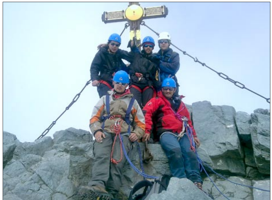
Stoperčani čisto na vrhu