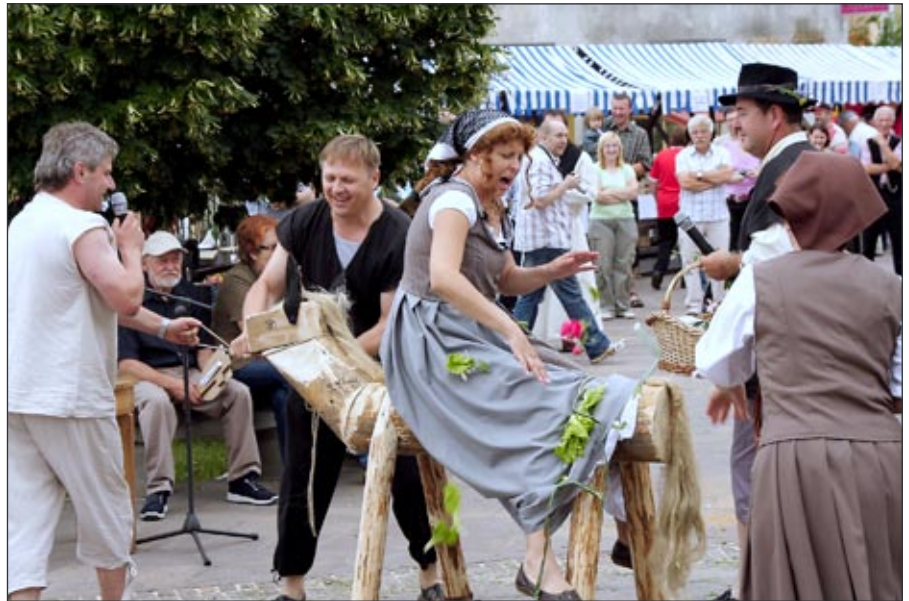
Člani Umetniškega društva Ustvarjalec Majšperk

poskusiti in kupiti veliko kulinarčnih dobrot, keramiko, zelišča, usnjene možničke, škornje, srednjeveški pisar vam je napisal ime s črnilom... Pripravili smo tudi 2 delavnici za otroke, na katerih so izdelali svoj meč in ščit ter ju lepo poslikali. Nato so spoznavali tehnike mečevanja.