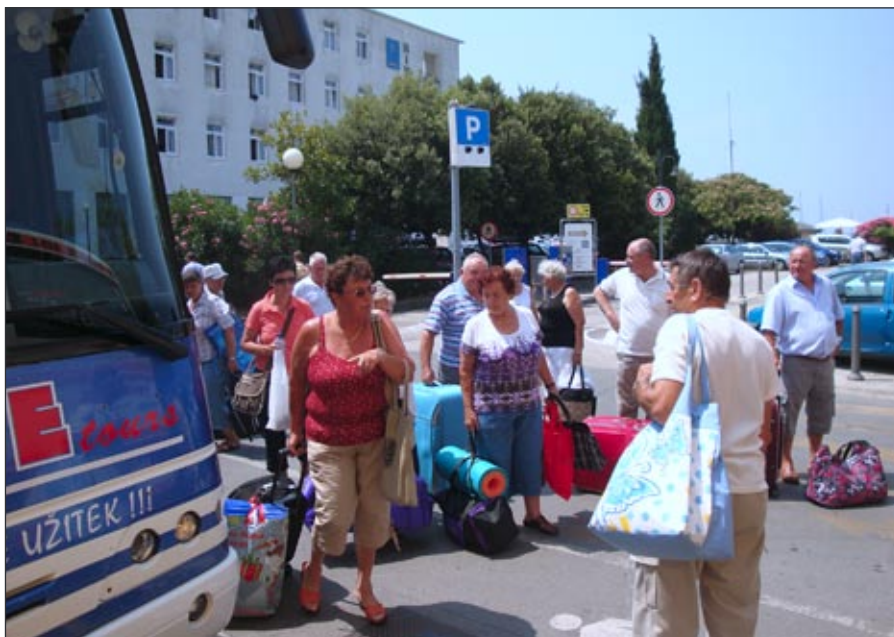
Naši upokojenci na morju

Leto hitro je minilo, invalide Društva invalidov Majšperk in Kidričevo na rekreacijo zvalo. Od 8.7. – 14.7.2010 smo v Izoli bili, lepo smo se imeli vsi. Odločili smo se tako, da zopet v Izolo gremo, saj dolgo let že v hotel Rivera hodimo. Tam smo kot doma, vse osebje nas že pozna. Z dvema avtobusoma smo se napotili, lepo sprejeti smo bili. Bilo nam je lepo, čeprav zelo vroče je bilo. Nekateri na soncu dolgo so vzdržali, drugi smo v senco se podali. Za vsakega je nekaj lepega bilo, teden dni preživeli smo krasno. Domenili smo se tako, če nam bo zdravje služilo, ponovili bomo spet vse to. Za vikend bomo septembra spet odšli, nakupni izlet v Trstu privoščili si ter v Riveri