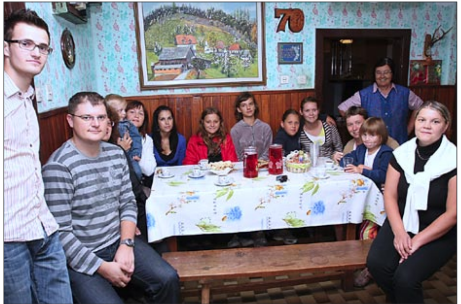
Gosotljubje na Fiderškovem vrhu za foto ustvarjalce

Domačnost krušne peči, hiša, ki te ponese za več kot sto let v preteklost, prečudovit razgled na Donačko goro in cerkvico Sv. Ane, so botrovali številnim dobrim fotografijam. Fotografirali smo domačine različnih generacij, ki so se bili pripravljene spogledovati s fotoaparatom. Tako smo v fotografski objektiv ujeli iskrivost otroških oči, življenjsko energijo in zasanjane poglede mladih, ter modrost, ki jo izžarevajo starejši. Foto delavnico smo zaključili ob pre-