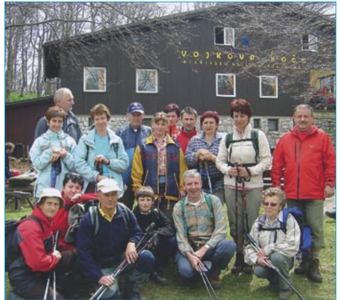
Na vrhu Nanosa

V začetku julija smo se odpravili še na Peco, ki že spada