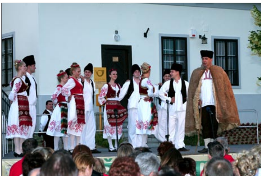
Naši gostje na plesnem odru na Ptujski Gori

Cirkulan, Rožmarina Dolena ter gostov iz Srbije zaplesalo na Vrazovem trgu ter pred mestno hišo na Ptuj. Mimoidoči so bili navdušeni. Večer je bil v znamenju gostujočih folklornih skupin iz Hrvaške, Srbije ter Slovenije. Tako so na odru zaplesali člani Folklornega ansambla Branko Radičević iz Sremske Mitrovice, Kulturno umjetniško društvo dr. Vinko Žganec Vratašinec, KPD Stoperce, folklorna skupina KD Cirkulane ter otroška in odrasla folklorna skupina FD Rožmarin Dolena. Koreografije so bile res čudovite, prav tako oblačila nastopajočih. Malce nagajivo je potekalo povezovanje programa, saj