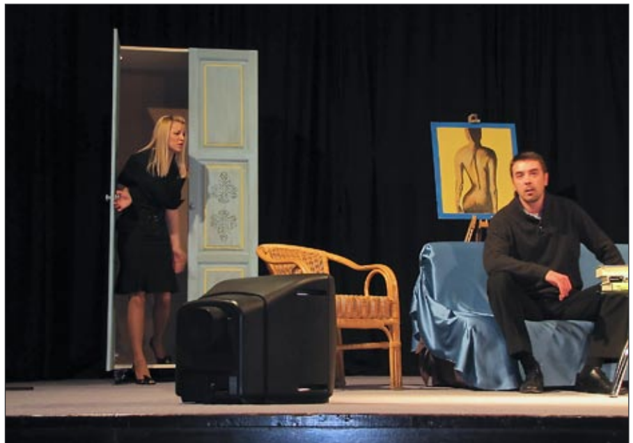
Limonada Slovenica v izvedbi društva SmoTeater

Majšperk dogovorili, da lahko za svoje namene uporabljamo občinske prostore nekdanje trgovine Mercator na Bregu. Tam smo si uredili manjšo prireditveno dvorano, kjer potekajo naše vaje, izdelava scene in priprave na naše prireditve. Prostor smo z lastnimi močmi in s pomočjo Občine Majšperk uredili in adaptirali. Tu je dovolj prostora tudi za našo sceno in rekvizite iz prejšnje sezone. To pa ni vse, kar se dogaja pri nas. V letu 2010 smo pri nas izvedli že dva plesna tečaja, tu so se zbrali krajanje Brega ob začetku adaptacije ceste skozi del Brega, nekajkrat so pri nas vadili tamburaši KUD Majšperk.