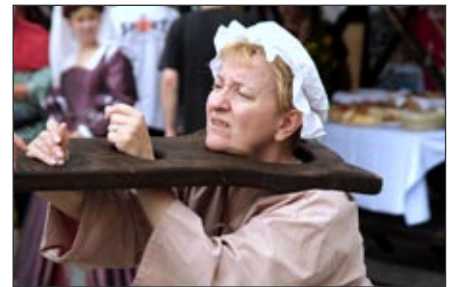
Nesrečnica v prenosnem prangerju.

Iskrena hvala tudi Albin Promotion d.o.o. (ozvočenje), PGD Ptujсka Gora, samostanu Matere Božje na Ptujski Gori, sponzorjem ter predvsem Občini Majšperk za vso podporo in pomoč. Žal se vsa TD niso mogla udeležiti prireditve, saj so imela gostovanja drugje