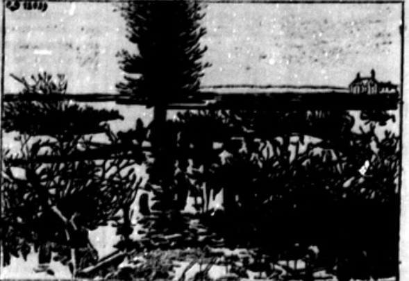
Das Überschwemmungsgebiet an der Oise.

Ob reki Oise so se vršili velikanski boji med nemškimi in angleško-francoskimi četami, kakor je bilo to razvidno iz uradnih poročil. Reka Oise je vled deževja preplovila pokrajine. Prinašamo sliko teh preplovljenih pokrajin, v katerih so ostali Nemci v splošnem zmagovalci.