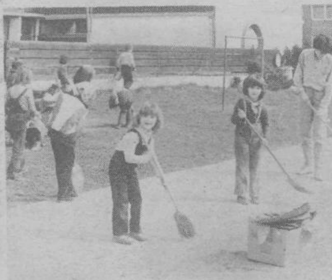
Tudi mlajši iz VVO Otona Župančiča se vključujejo v akcijo za čisto in zeleno Ljubljano