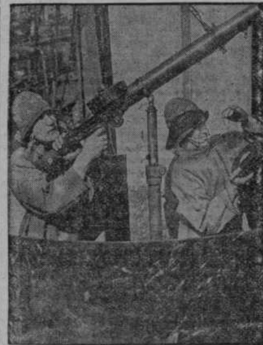
Angleški ribiški čolni so oboroženi s strojnicami in topovi