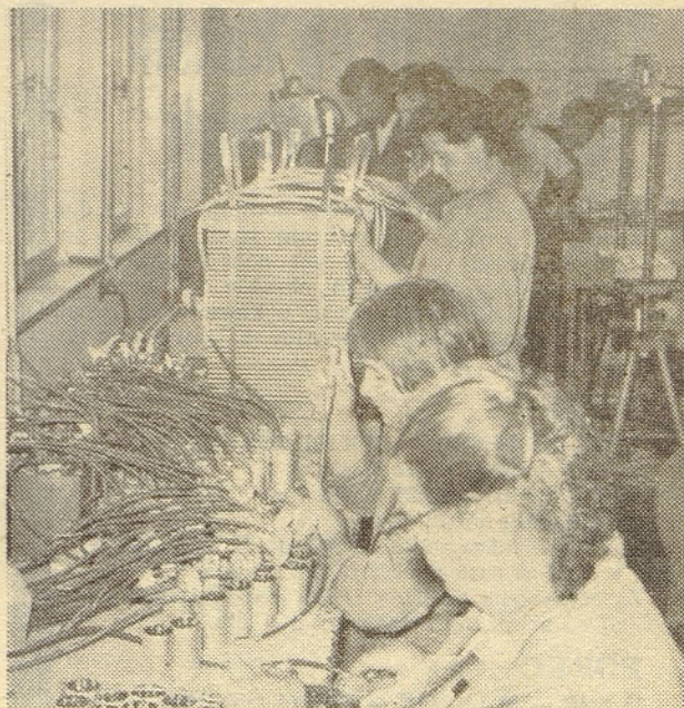
Iz proizvodnje lončastih kondenzatorjev v tovarni v Semiču

Pomembno je tudi dejstvo, da tovarna sklepa tudi dolgoročne izvozne pogodbe s solidnimi partnerji v inozemstvu, kar je nedvomno dokaz za njeno uspešno uveljavljanje, lepa perspektiva za delovni kolektiv, hkrati pa