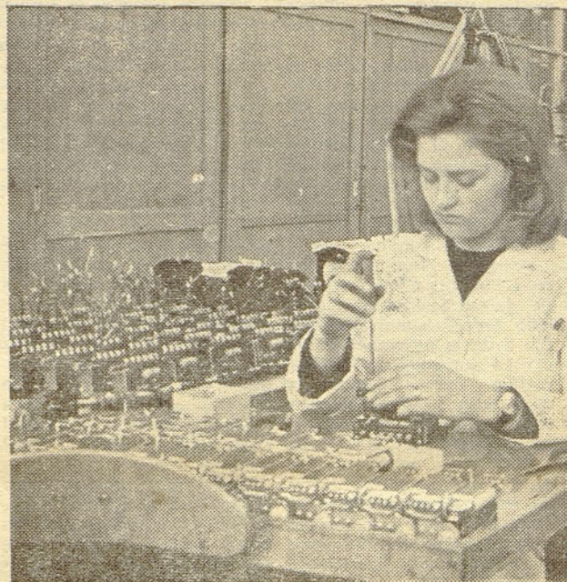
Iz montažnega oddelka naše tovarne v O...