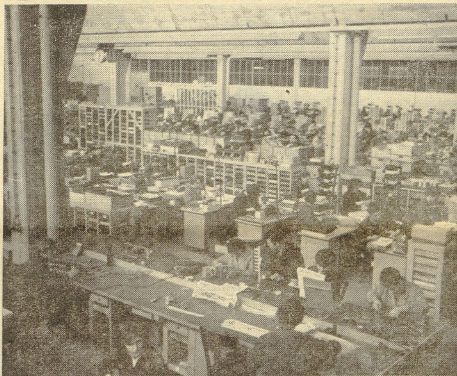
Te dni so bile delovne enote »Elektromehanike« Kranj v razgibani predpripravi za volitve v samoupravne organe, ki bodo 21. aprila. Tudi kolektiv obrata avtomatskih telefonskih naprav (na sliki montažna hala) — je skrbno izbiral kandidate, ki jih bodo zastopali v delavskem svetu podjetja, tovarne in obrata ATN