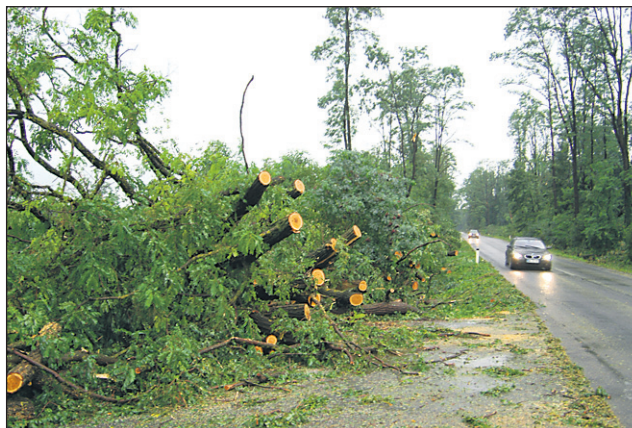
Med okoli 300 podrtimi drevesi jih je največ, vsaj 50, padlo čez lokalno cesto od kidričevega Taluma do Hajdine.

Začasno so prekrili s folijo dve strehi na stanovanjski hiši na Sp. Hajdini 57 in 54 a. Odstranili so več podrtih električnih drogov na Sp. Hajdini 57 in 70, Zg. Hajdini