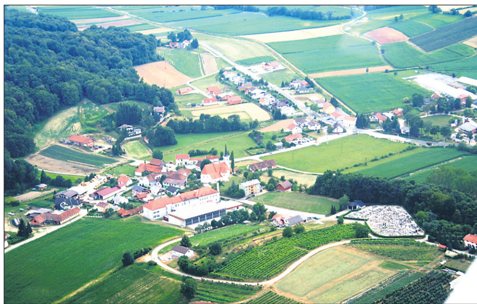
Iz zraka je vse videti idilično, ampak v občini Juršinci se jeseni obeta še kar nekaj investicij.

Destrnik • Podpis pogodbe za izgradnjo zdravstvenega doma