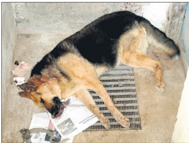
Zastrupljen pes Reks je moral poginuti v težkih mukah, saj je krvavel iz ušes in gobčca.

robe, pa sem bil trdno prepričan šele v ponedeljek zjutraj, saj je še vedno nemočno ležal na istem mestu, poleg ušes pa je bil ves krvav tudi okrog gobca. Bilo je videti, da je popolnoma brez moči, saj se je na moje priganje komaj nekoliko premaknil.«