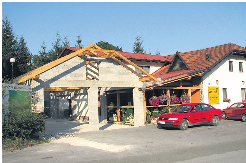
Ob občinsko-zasebnem objektu, kjer je v pritličju znana okrepčevalnica Vrček, v mansardi pa krajevna dvorana, je že zelo zrasel nov objekt – večja jedilnica –, ki je zaenkrat še črnogradnja.