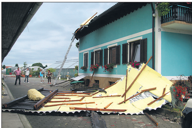
Brez strehe nad glavo, s poškodovanim gospodarskim poslopijem in poškodovanimi rastlinjaki so ostali tudi Zupaničevi iz Spodnje Hajdine 57.