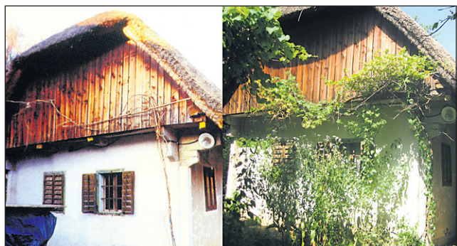
Pušnikova domačija pred nekaj leti in tik pred začetkom čiščenja pred nekaj dnevi.