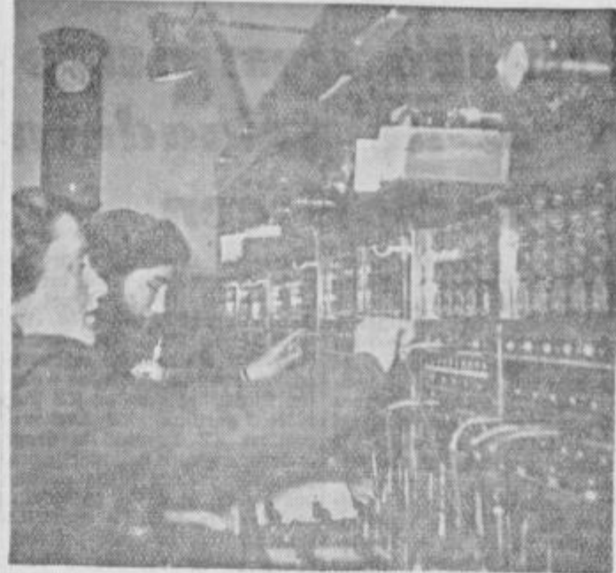
Telefonska centrala pošte Ptuj

V nedeljo, 6. februarja t. l., dopoldne se bodo okrog telefonistk in ostalih uslužbencev ptujске pošte zbrali na občnem zboru sindikalne podružnice ptujskih uslužbencev tudi vsi ostali člani iz pošt ptujskega okraja in bodo v navzočnosti gostov iz Ljubljane, Maribora in Ptuja poslušali obračun odbora za lansko leto, razpravljali o novih predlogih glasovalci za nov odbor in sklepe nazadnje pa se razveselili kot družina, ki je zbrana ob velikem prazniku. K. V.