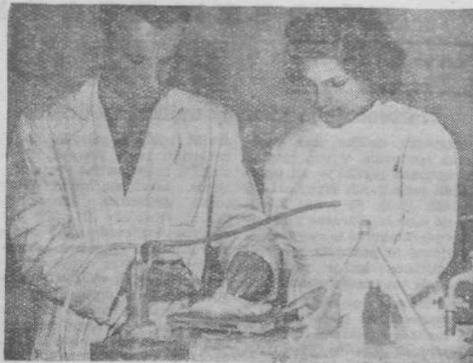
Detajl iz Vinče

Atomi so nekajkrat večji od njihovih jeder, pa so vendar tako majhni, da na 1 milimet dolžine lahko nanizamo okrog 100 milijonov atomov.