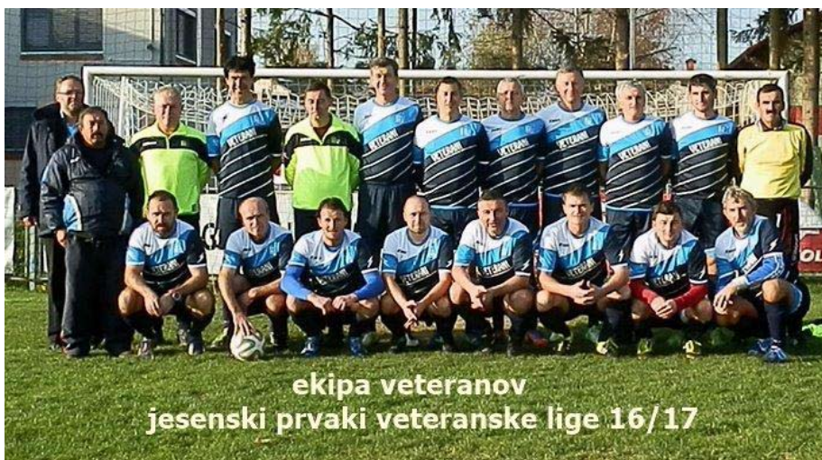
ekipa veteranov jesenski prvaki veteranske lige 16/17

Selekcija U9 in U11 v zimskem času tekmujeta v športnem centru Triglav Ljubljana. Ekipa do devet let je odigrala 6 krogov tekmovanja zimске lige in z odigranih srečanj iztržila 5