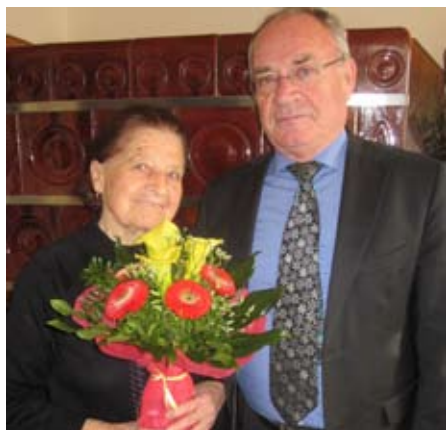
Koderman Terezija iz Dol