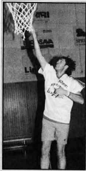
Domov center dr. Vasja Jarc

V D ligi se je torej vse izteklo po pričakovanjih. V zadnjem prvenstvenem kolu sta namreč slavila tako goriški Dom kot tržaški Santos, ki si zato delita prvo mesto na lestvici. Za določitev prvaka D lige bo torej potrebno dodatno srečanje na nevtralnem igrišču (v soboto, 31. maja, ob 19.30 v Štarancu). Nato bodo odigrali še tekmo med drugouvrščenima ekipama tržaškogoriške in videmske-pordenonske skupine. Tako je bilo namreč določeno pred začetkom prvenstva, sedaj pa bi lahko bil ves ta postopek zaman. Košarska zveza namreč pripravlja reorganizacijo lig, po kateri naj bi v C2 ligo napredovale prve tri uvrščene peterke. Tako se je v igro napredovanja nepredvidoma vpletel tudi Bor Radenska, ki je po zmagi v zadnjem kolu zasedel prav končno 3. mesto.