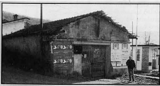
Nekdanji skedenj, kjer danes stoji cerkev