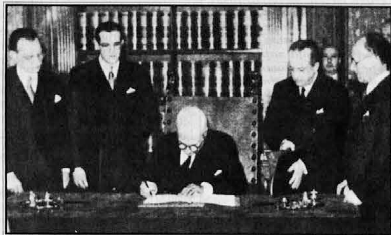
Enrico De Nicola podpisuje novo italijansko ustavo, ki je postala veljavna 1. januarja 1948. Prvi na levi De Gasperi, prvi na desni Terracini.