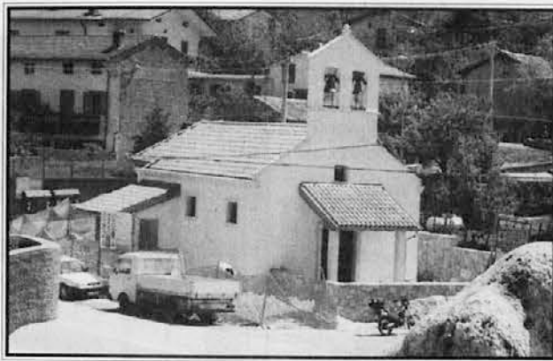
Cerkev na Palkišču pred dvema tednoma

Z dobrotniki je takole: župnik pobira prispevke po družinah. Jaz sem z druge strani zbral imena in podatke vseh