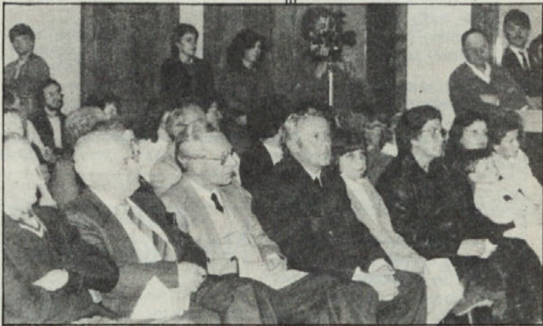
Vigredni koncert je bil zelo dobro obiskan.