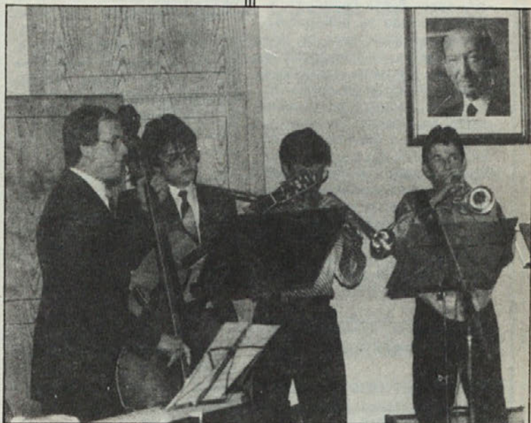
Ansambel STRANJE je spremljal mladinski zbor.

Soprireditelj: katoliško prosvetno društvo „Drava“ v Žvabeku