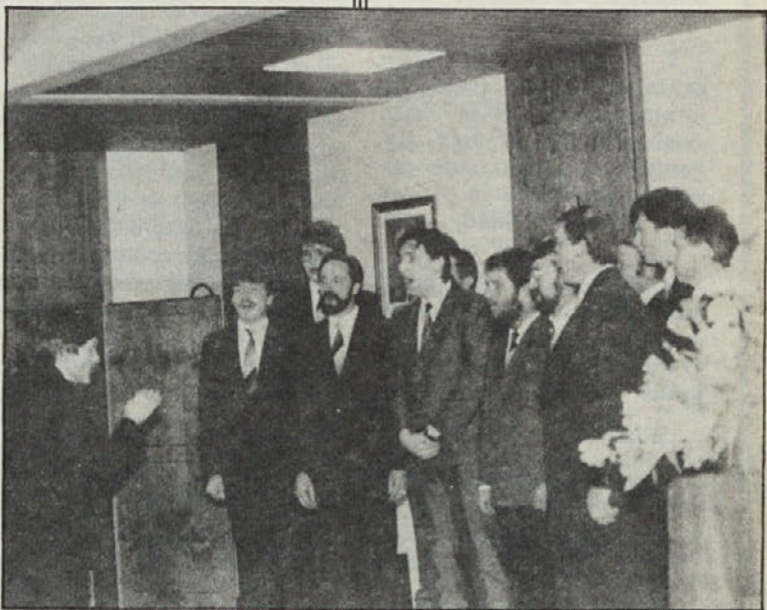
MoPZ iz Bilčovsa

Krščanska kulturna zveza v Celovcu vabi na