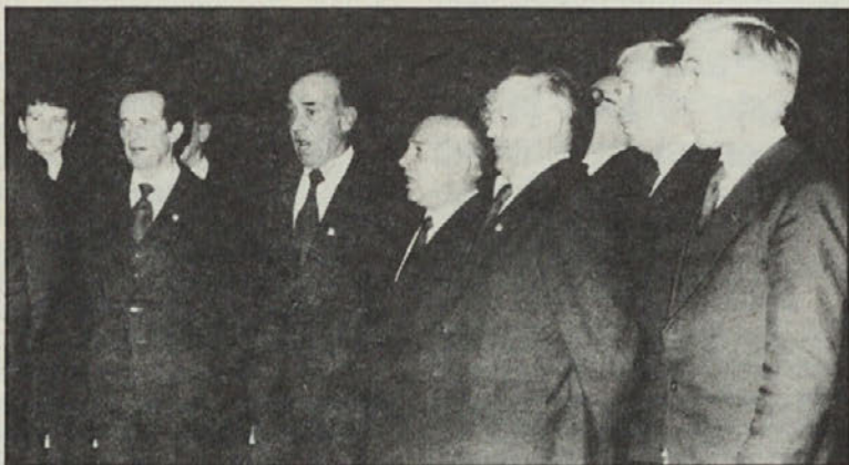
MoPZ „Foltej Hartman“ iz Pilberka

kulturni teden pa se je iztekel s koncertom moških pevskih zborov iz Podjune. Na tem koncertu so nastopili MoPZ „Foltej Hartman“, MoPZ SPD „Trta“, MoPZ „Vinko Poljanec“, MoPZ „F. L. Lesičjak“, vokalni kvintet Št. Lipš in Globaški puebi.