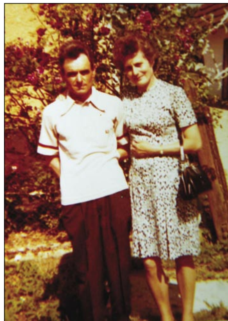
Drugi mauž je bijo djagar iz Števanovec

zvali, steri je pozvau rešilni auto. On je do slejdnjoga gunčo, eštje od ženē pa od familije je slobaud vzejo prvin kak so ga v špitale pelali. V špitalaj so gorprišli, ka je vekša baja, kak se je tau na prvi pogled vidlo. Poškodovau si je lobanjsko dno (agy- alapi tōrés) pa je za par dni mrrau. Tak je njegva žena z