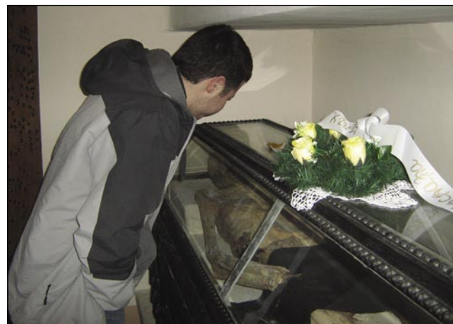
Iz oči v oči z mumíjo

Trüdni od poti so se dijaki pa študenti vseli k veukomi stoli. Ništerni so se sploj čüdiva-