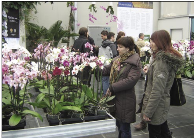
Cvejt pred cvejtom v Dobrovniku

živejo Madžari tó. Firma v etoj vesnici pauva orhideje, rauže s tropskoga sveta, od leta 2003. Na 3 hektaraj rasté več kak milijon orhidej na leto, štere odavajo doma pa