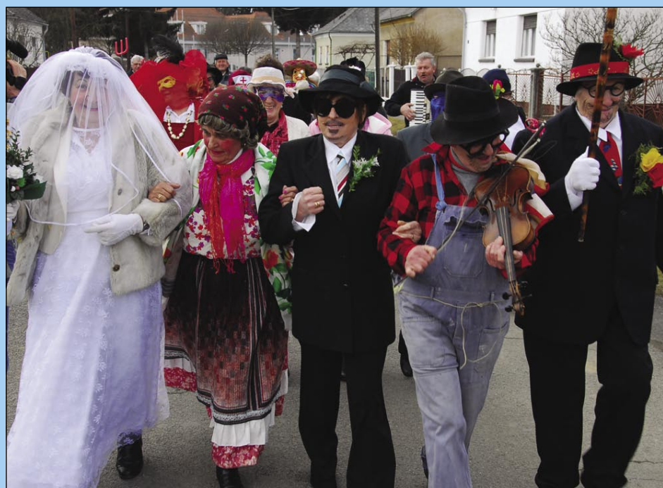
Na fašensko nedelo so členi Društva porabski slovenski penzionistov pripravili maškarado pa fašenski ples (več o tom v naši drugi novinaj.)