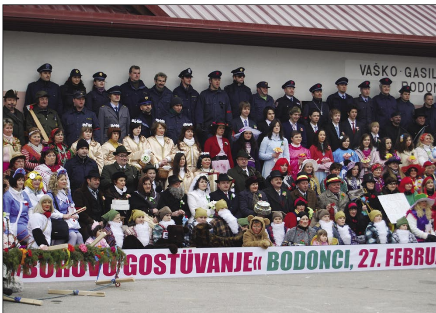
Prva kak se je začnilo borovo gostüvanje, so se vsi postavili pred fotografie

Po tistom, ka si ženin in nevesta segneta v roke, farar povej: »V imeni njegovon