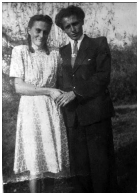
Botra s prvim možaum

»Šegau majo prajti, ka je dobra botrina več vredna kak lagva žlata. Pri nas je tō tak bilau. Za krstno botro sam pri obadvōma sinea tisto žensko zvala, stera je nam po krvi nej žlata bila, dapa eštje zdaj, po petdeseti lejtaj smo trno dobri, vkūp ojdimo pa se poštvamo.