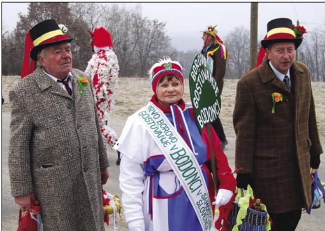
Prvo borovo gostüvanje v Bodonci v samostojni Sloveniji

do goške Kralešček, gde je snejo čako njeni mladoženec, njeni baur.