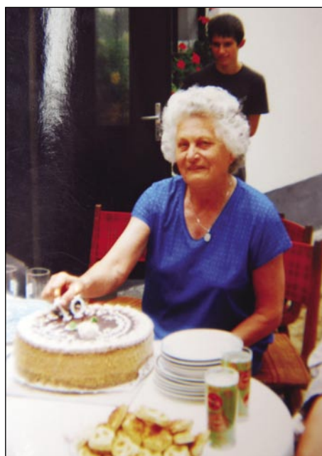
Botra, gda smo svetili njeni 70. rojstni den

mali detetom devica (vdova) gratala. Njeni mauž je mrrau 1961. leta. Eno leto po tistim je mrrau njeni tast (após) tō, tak je te tašča (anyós) tō devica postala. Deteta sta eštje nej 6 lejt stariva bila, sta eštje