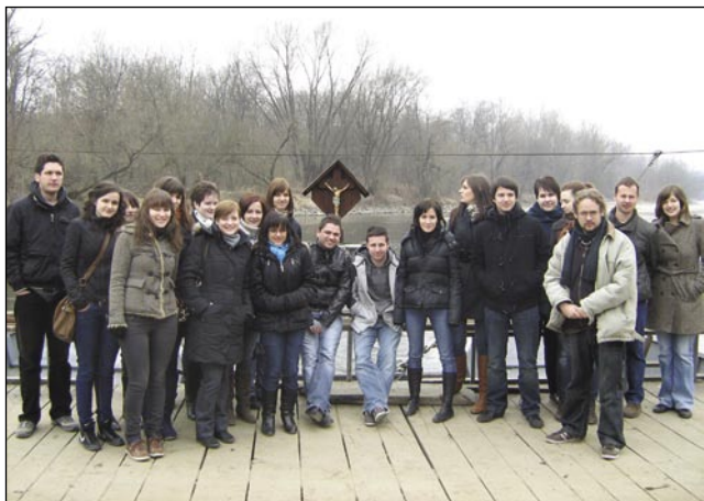
Skupina Porabcov pa Prekmurcov na Müri

zvekšoga v sausednji rosagaj. Lejpe cvejte leko najgir lidgé kúpíjo tó (na busi od mladi se je je več najšlo), majo pa tropski gračenek, gde se leko vsikši počüti, kak lik bi odo v vraučí krajínaj s vsefelé rastlinami (növények).