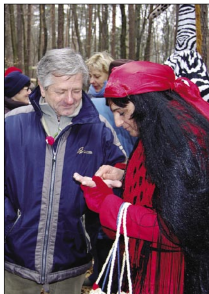
Ciganjice so vsakšomi povedale, če de emo srečo ali nej

Tou je bila šola za vse mlade in ne pozabite na nas stare. Gospod naš zeleni, ti dale kralüj v svojon reviri, mij pa idemo zdaj na gostijo in vsi se lejko z nomi veselijo.