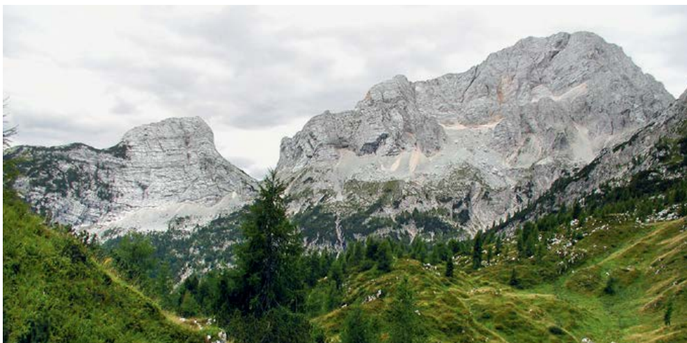
Iz Zadnje Trente dobršen del vzpona gledamo Bavški Grintavec pred seboj.

Če južni pristop na vrh velja za najlažjega, je severni najzahtevnejši. Že lažja različica, ki se izogne sedlu Kanja, ni od muh, težja pa sodi v sam vrh zavarovanih poti na dvatisočake pri nas. Obema potema je skupna tudi gornikom nič kaj prijazna krušljivost. Predvsem v zgornjem delu poti moramo biti