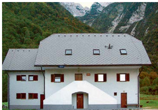
Planinsko učno središče Bavšica

Pod Bavškim Grintavcem stoji Planinsko učno središče (PUS), s katerim upravlja Mladinska komisija PZS. V njem se izobražujejo planinski vodniki, mentorji planinskih skupin, mladinski voditelji, varuhi gorske narave, markacisti, turni kolesarji, orientacisti in še kdo. V Bavšici potekajo tudi številni tabori planinskih društev. Dom oddajajo v najem pod pogojem, da bodo v njem potekale izobraževalne vsebine. Več o središču si lahko preberete na spletni strani http://mk.pzs.si/pus/ .