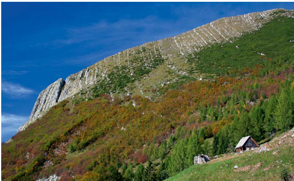
Pot iz vasi Soča vodi čez planino Nad Sočo.

Opise začenjamo z najlažjo, vendar hkrati najnapornejšo potjo na vrh. Bavški Grintavec se nad vasjo Soča dviguje tako visoko, da z lahkoto konkurira Triglavu nad Aljaževim domom. Napornost ture