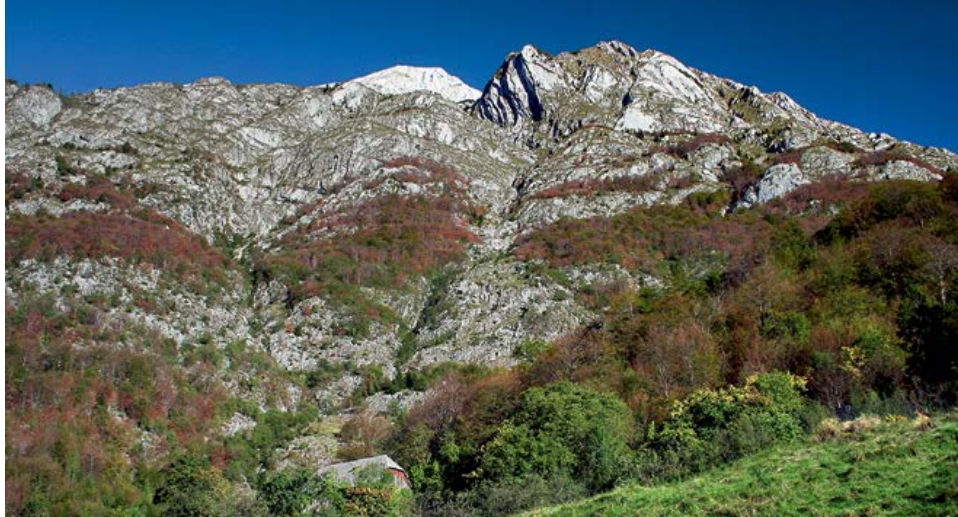
Lemovje, vas pod Bavškim Grintavcem, nima več stalnih prebivalcev.

Vas, v kateri ni več stalnih prebivalcev, se sonči na prisojnih pobočjih nad Spodnjo Trento, slabo uro hoda nad vasjo Soča ob markirani poti na Bavški Grintavec. Nekatere hiše, zelo značilne za to območje, so še dobro ohranjene. Med travniki in pašniki, ki se vse bolj zaraščajo, lahko vidimo kamnite zidove oziroma mire . Zadnji ljudje so v vasi živeli pred dobrimi štiridesetimi leti. V starejši literaturi najdemo tudi zapisa Lemovlje in Lomovlje.