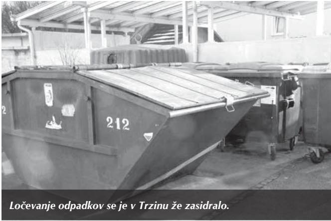
Ločevanje odpadkov se je v Trzinu že zasedrilo.

Eden od takih skupnih projektov je tudi Regijski center za ravnanje z odpadki (RCERO) oziroma sežigalnica na Barju, kot projektu tudi rečejo. Mestna občina Ljubljana se je pred kratkim odrekla svoji načrtovani sežigalnici odpadkov, tako da bo za Ljubljano uporabna le še sežigalnica v sklopu RCERO. Slišali pa smo, da imajo načrtovalci projekta nekaj težav, ker ugotavljajo, da bodo v sežigalnico dobili manj odpadkov, kot so prvotno načrtovali. Po občinah namreč vse bolj uspešno ločujejo odpadke, tako da jih je veliko več primernih za predelavo, vse manj pa za sežigalnico. Kako je zdaj s tem?