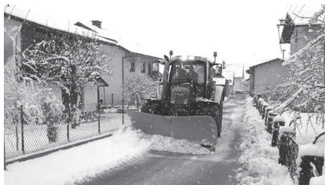
Pluženje na Habatovi ulici konec januarja 2015

Meteorološka zima je tik pred koncem. Še tisto, kar je od nje ostalo, so prejšnji teden pregnale pustne šeme. Vse kar smo imeli od zime, je bila »pobožična« uvertura in neuresničena snežna kataklizma v začetku tega meseca. Vendarle smo imeli konec januarja že 14 dni snežno odejo, kar je na primer nekajkrat več kot lani, ko je bila le vzorčne narave. Posebno obravnavo to zimo si gotovo zasluži napoved izrednega snežnega dogodka na začetku februarja, ki pa je tudi po poteku ostal pri tem, torej »le« pri napovedi. Mraz in veter sta se uresničila, obljubljenega do pol metra snega v osrednji Sloveniji pa od nikoder. Seveda na tem mestu ne bomo kritizirali naših »vremenoznalcev«, saj so zadnji vremenski modeli v večji meri zaznali premik, natančneje odmik oziroma zaustavitev padavin vzhodno od Ljubljanske kotline. A je bilo takrat že prepozno, saj so mediji več kot odlično opravili svoje delo. Začasno se je ukvarjala z »vremenoznalstvom« celo šolska ministrica, ki je izdala okrožnico z naslovom »Šolski koledar 2014/2015 – spremembe zaradi izjemnih vremenskih razmer«. Z njo je razveselila številne »šolomrzce«, mnogo manj pa šolnike, ki bodo morali nadomestiti izpadli dan pouka. Še več, morebitno odpadlo proslavo ob slovenskem kulturnem prazniku so lahko nadomestili tudi post festum.