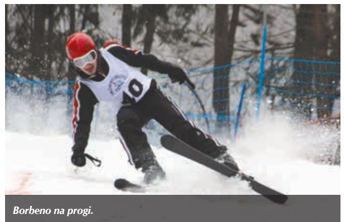
Borbena na progi.