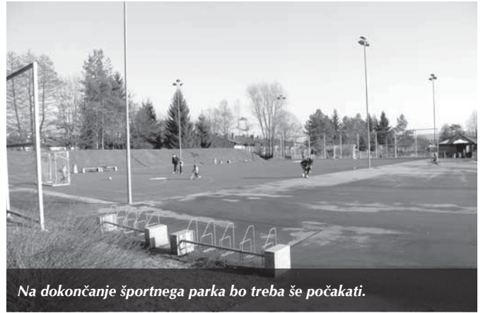
Na dokončanje športnega parka bo treba še počakati.

Že pred časom smo se odločili, da preidemo na ločeno zbiranje odpadkov neposredno pri porabnikih, zato so ti dobili tudi več vrst zabojnikov. Zdj embalažo zbirajo v rumenih zabojnikih in uporabniki, ki imajo tovrstnih odpadkov več, lahko zahtevajo večje zabojnike, kar ne bo vplivalo na ceno odvoza