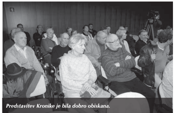
Predstavitelj Kronike je bila dobro obiskana.