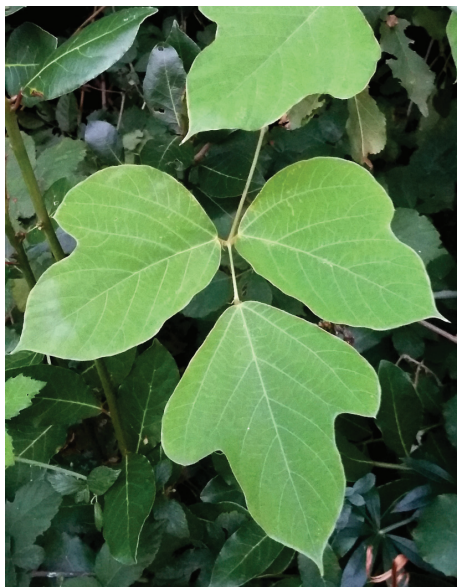
Slika 1: List kudzuja je sestavljen iz treh lističev.

Vsi deli rastline (listi, listni peclji, steblo, stroki) so bolj ali manj dlakavi. Listi (dolgi 8–20 cm in široki 5–19 cm) so dlanasto sestavljeni iz treh lističev, ki so ovalni do okrogli, nedeljeni do trokrpi (FORSETH & TERAMURA 1986). Zgornji listič je največkrat trokrp, stranska lističa pa dvo- ali trokrpa (sl. 1). Na isti rastlini se lahko oblika listov zelo razlikuje (VAN DER MAESEN 1985). Listi so na zgornji strani svetlo zelene barve, na spodnji strani so svetlo do sivkasto zeleni (MITICH 2000). Po obliki listov je kudzu sicer nekoliko podoben gojenemu navadnemu fižolu ( Phaseolus vulgaris L.), ki ima le rahlo dlakave liste (KUS VEENVLiet & al. 2017).