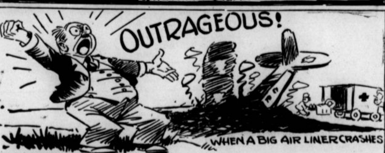
WHEN A BIG AIR LINER CRASHES