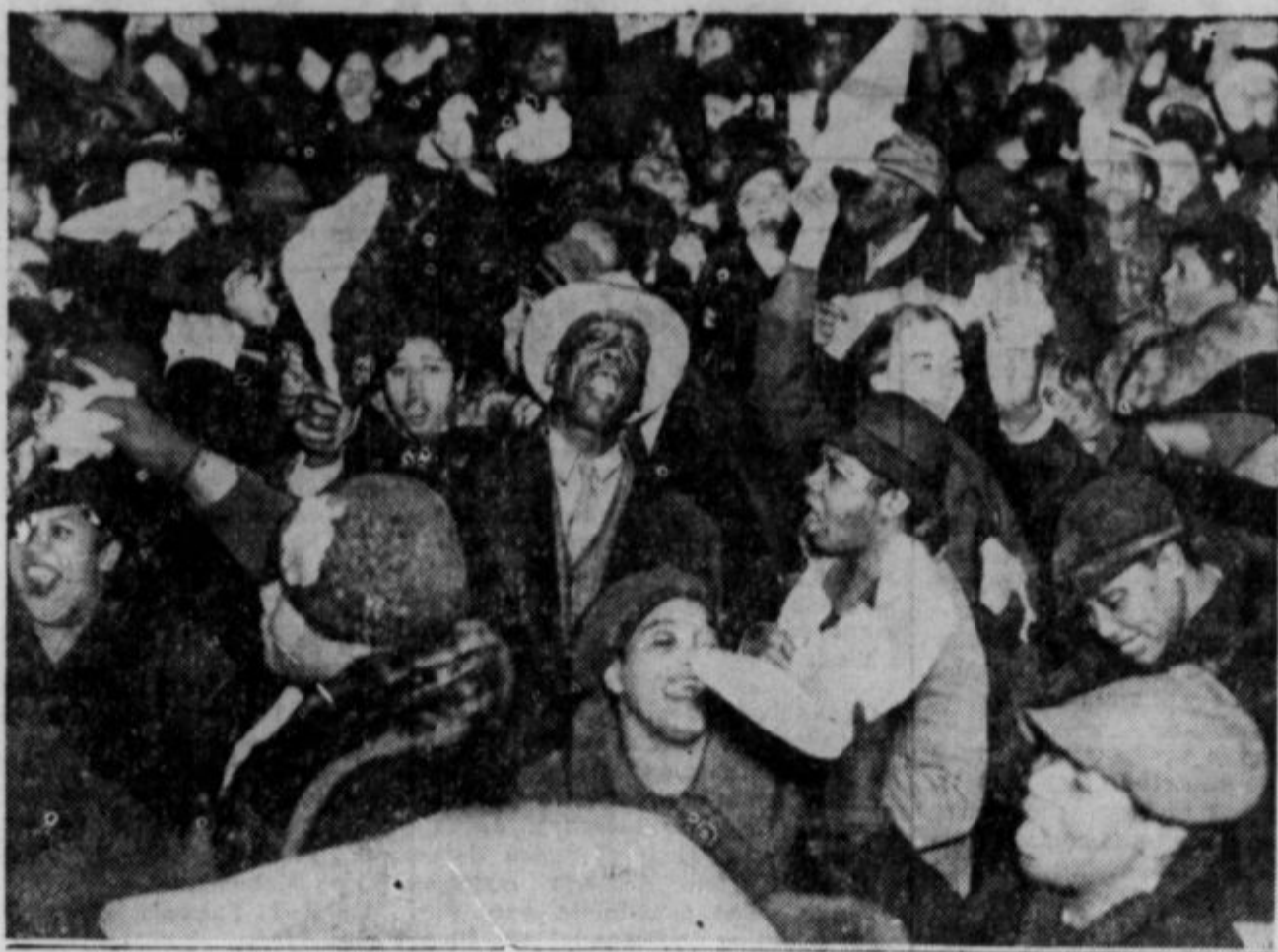
"Father Divine v New Yorku je "čudodelnik" in "bog". Vsa tako misli tisoče zamorcev v newyorškem zamorskem predelu Harlem. Nedavno pa je prišel "father" Divine v navzkrižje z oblastmi in policija ga je aretirala. Takoj se je zbrala množica tisočev in sila ved...