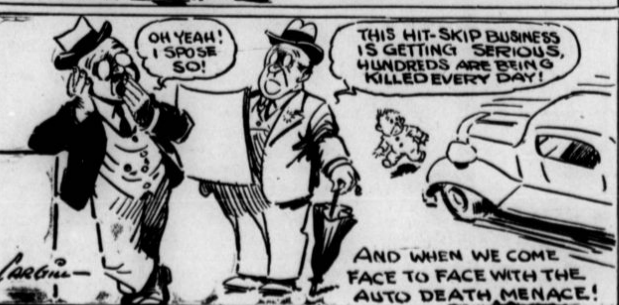
AND WHEN WE COME FACE TO FACE WITH THE AUTO DEATH MENACE!