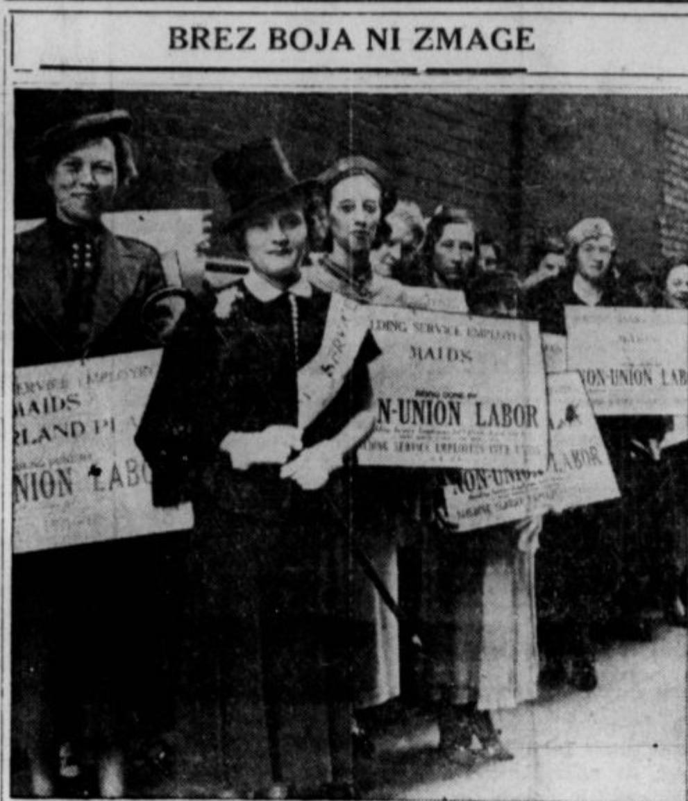
Delavke v hotelih so zelo slabo plačane. V hotelu Netherlands-Plaza v Cincinnatiju so se organizirale in pričele piketirati, kakor jih vidite na gornji sliki. Stavkale so samo par ur. Plača jim je bila zvišana 35 odstotkov. Se veliko večja stavka hotelskih delavcev se je zgodila v San Franciscu. Poravnana je bila ta teden.

Ako se pred zakonom smatra unijo odgovornim za škodo, ki bi jo napravili delavci v stavkah, bi bilo tožb proti njim za odškodnino nič koliko. Delavce je v stavkah lahko provocirati. Prej LaFollettovo komisijo je izpovedala marsikatera priča, kako kompanije najemajo agente provokatorje zgolj zato, da provocirajo stavarke k izgredom, na pobiranje oken itd., kajti na način je delodajalcem najlažje dobiti pomoč policije,